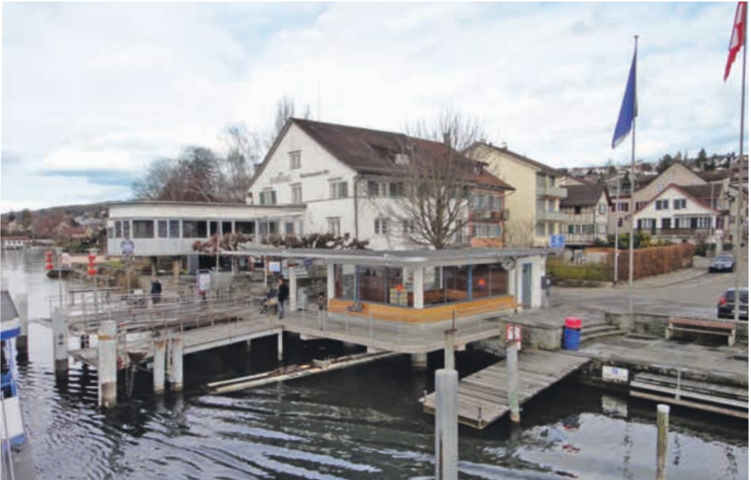
▲ Schiffswartehalle Erlenbach, 2011. Die Schiffswartehalle von 1939 mit dem Restaurant Schönau im Hintergrund.

In Herrliberg entstand vor 1906 ein erster Dampfschiffsteg bei der Post (heute «Bellevue», Seestrasse 157), und ab 1900 legten die Schiffe am Steg beim ehemaligen Hotel Raben an. Hier wurde 1931 ein neuer Dampfschiffsteg eingeweiht und erst 1996 eine einfache offene Wartehalle aufgestellt.