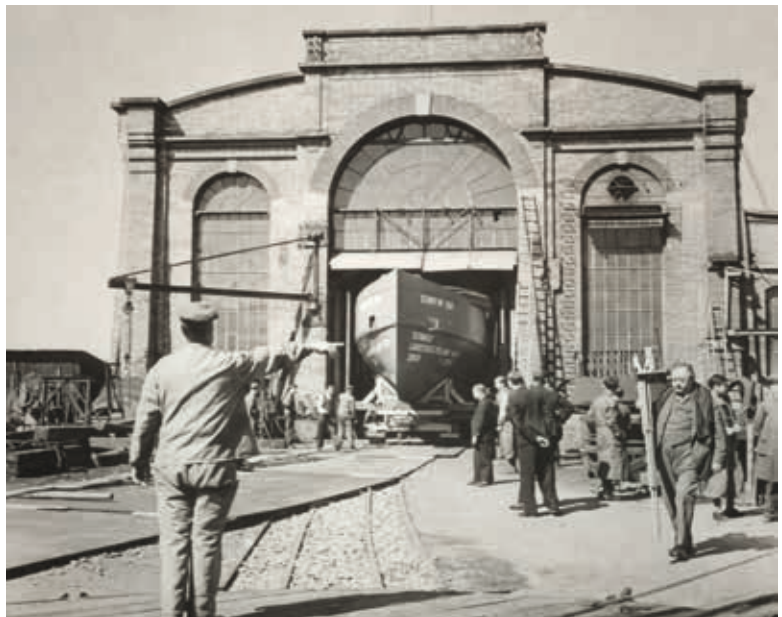
Schiffbauhalle auf dem Escher-Wyss-Fabrikareal, Zürich, 1939. Die Schiffbauhalle wurde 1892 in Zürich Aussersihl erbaut. Der Bau steht seit 1994 als einer der wichtigen Zeugen der aufstrebenden Zürcher Industrie des 19. Jahrhunderts unter Schutz und beherbergt seit 2000 eine Filiale des Zürcher Schauspielhauses.

Die Maschinenspinnerei Escher, Wyss & Cie. wurde 1805 in Zürich gegründet und entwickelte sich von der Spinnerei zur Maschinenfabrik für Textilmaschinen, Wasserturbinen und andere technische Anlagen. 1835 mit der Montage der aus England importierten Maschinenteile des ersten Zürichseedampfers Minerva beauftragt, erlangte Escher Wyss beim Zusammenbau der Maschinenteile die notwendigen Kenntnisse und Erfahrungen für eigene Konstruktionen. Bereits 1836 entstand die als erste selbstständige Konstruktion für den Walensee bestimmte «Linth Escher».