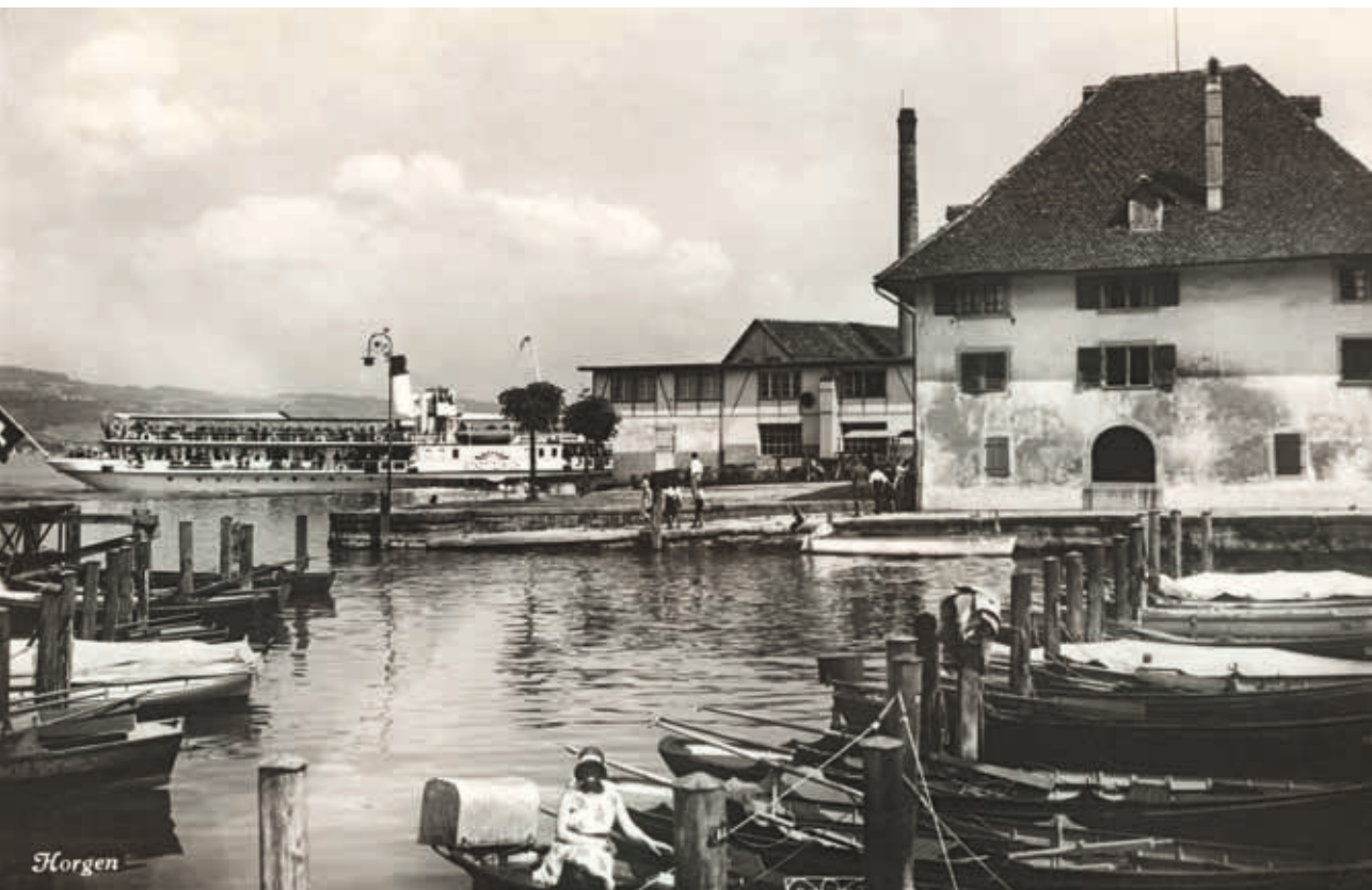
▲ Bootsplätze bei der Sust in Horgen.

Die Bauten der Gattung «Schiffswartehalle» kommen am Zürichsee ausschliesslich als eingeschossige Solitärbauten vor und zeichnen sich durch die Wartehalle aus, die als Innenraum oder als lediglich überdeckter Gebäudeteil ausgeformt unweit vom Ufer die wartenden Schiffspassagiere vor Wind und Wetter schützen soll. Bei vielen der Kleinbauten ergänzen auf der seeabgewandten Seite Nebenräume wie Toiletten, Materialräume und Telefonkabinen das Raumprogramm. Die Schifffahrtsgesellschaft verkauft die Billette bis heute an Bord der Schiffe, sodass auf Personal und entsprechende Räumlichkeiten an den Stationen verzichtet werden konnte.