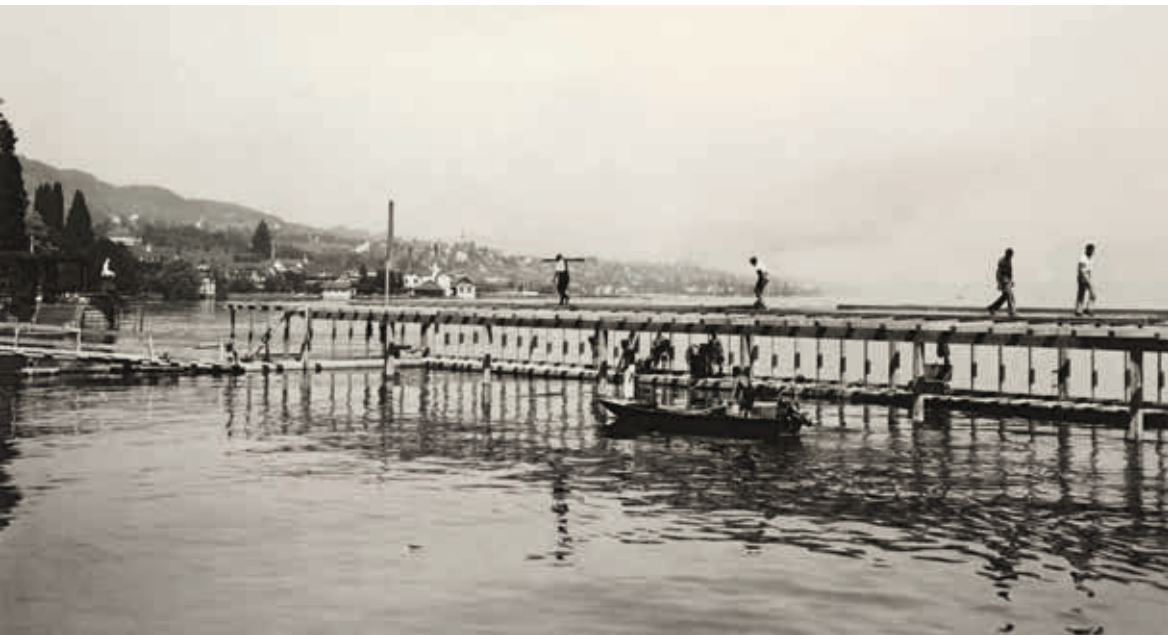
▲ Haab bei der Seerose, 1937 erbaut und 1948 erweitert.

In Horgen sind zwei Werften angesiedelt, wobei sich die Yachtwerft Faul AG auf das Angebot von Gesamt-Dienstleistungen rund um das Boot spezialisiert hat. Sofern gewünscht, wird nebst dem Unterhalt des Bootes auch der Picknickkorb bereitgestellt. Die Bootswerft F. Huber AG besitzt keine frei vermietbaren Bootsplätze. Beide Werften verfügen über Winterlager.