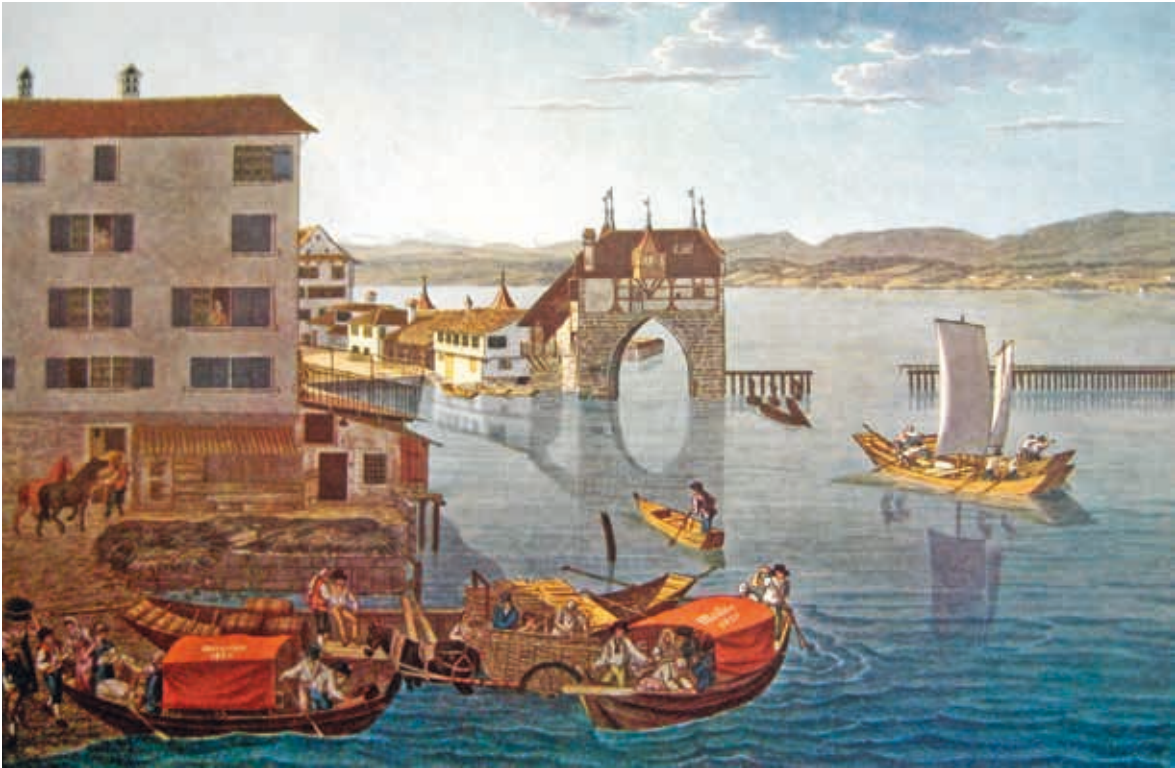
▲ Zürcher Schiffflände mit Grendeltor, um 1820. Im Vordergrund sind die Marktschiffe der Seegemeinden Oberrieden und Meilen zu sehen. Sie verkehrten bei jedem Wetter und waren auch nachts unterwegs, was bei der einfachen Ausrüstung nicht ungefährlich war, um am Morgen rechtzeitig vor Marktbeginn in der Stadt einzutreffen. Gegen Abend fuhren sie wieder in ihre gemeindeeigenen «Haaben» zurück.

Auf dem Zürichsee werden heute von der Zürichsee-Schiffahrtsgesellschaft die beiden Salonraddampfer Stadt Zürich und Stadt Rapperswil als Kursschiffe eingesetzt. Seit 1970 engagiert sich der Verein «Aktion pro Raddampfer» für den Erhalt der letzten beiden Zürichsee-Dampfer. Die Raddampfer Stadt Zürich und Stadt Rapperswil wurden über die Jahre mehrmals baulich verändert, bevor sie mit der Unterstützung der Kantonalen Denkmalpflege Zürich in mehreren Etappen fachgerecht restauriert und technisch erneuert werden konnten. Als bedeutende Zeugen der Technikgeschichte erfreuen die aufwendig restaurierten Schiffe heute während ihres Einsatzes in der Sommersaison ein grosses Publikum.