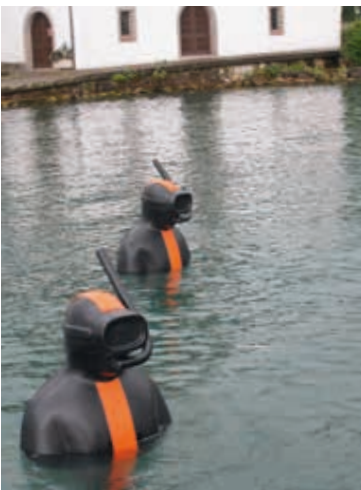
▲ «Police-Divers» vor der Horgner Sust, 2004.