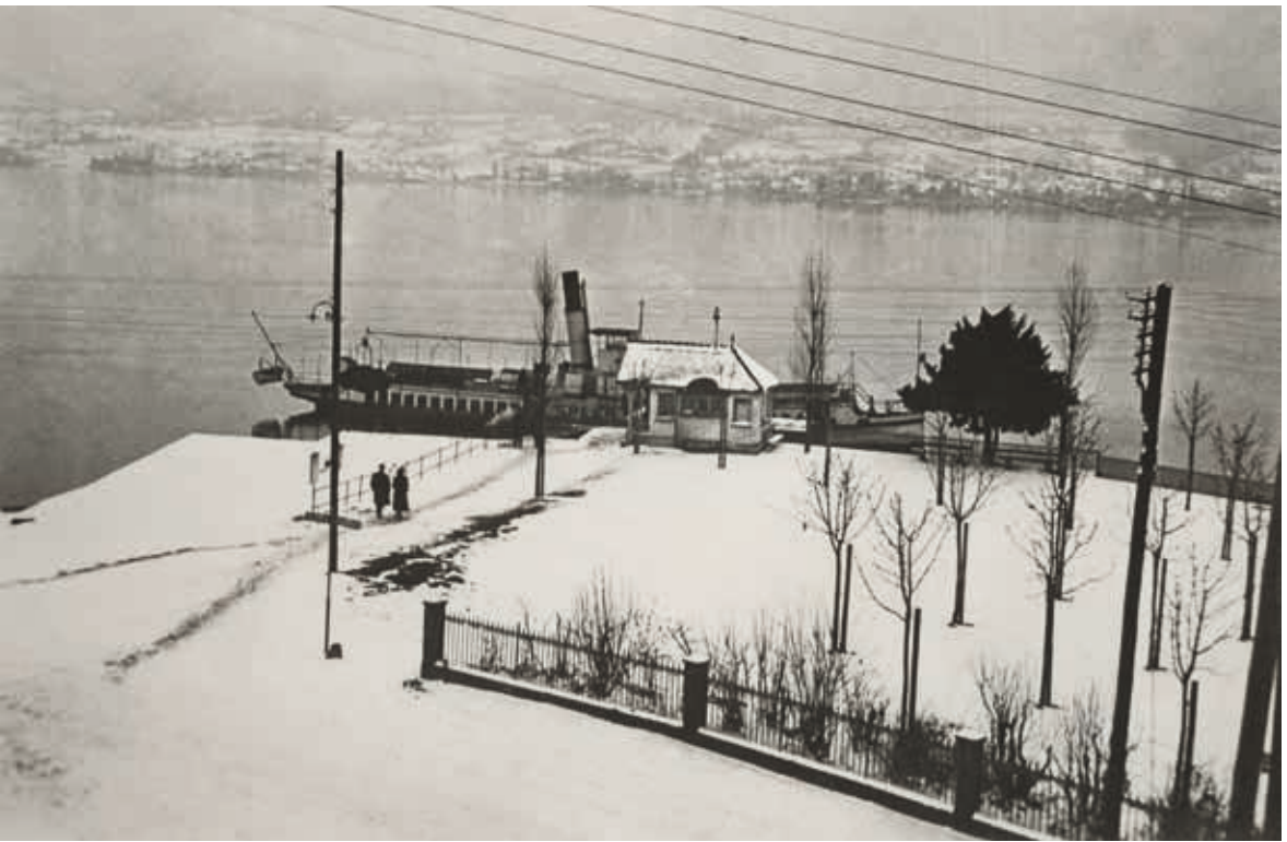
▲ Schiffswartehalle Rüschtlikon, 1920.