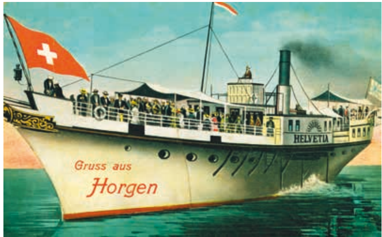
Raddampfer Helvetia, 1922.