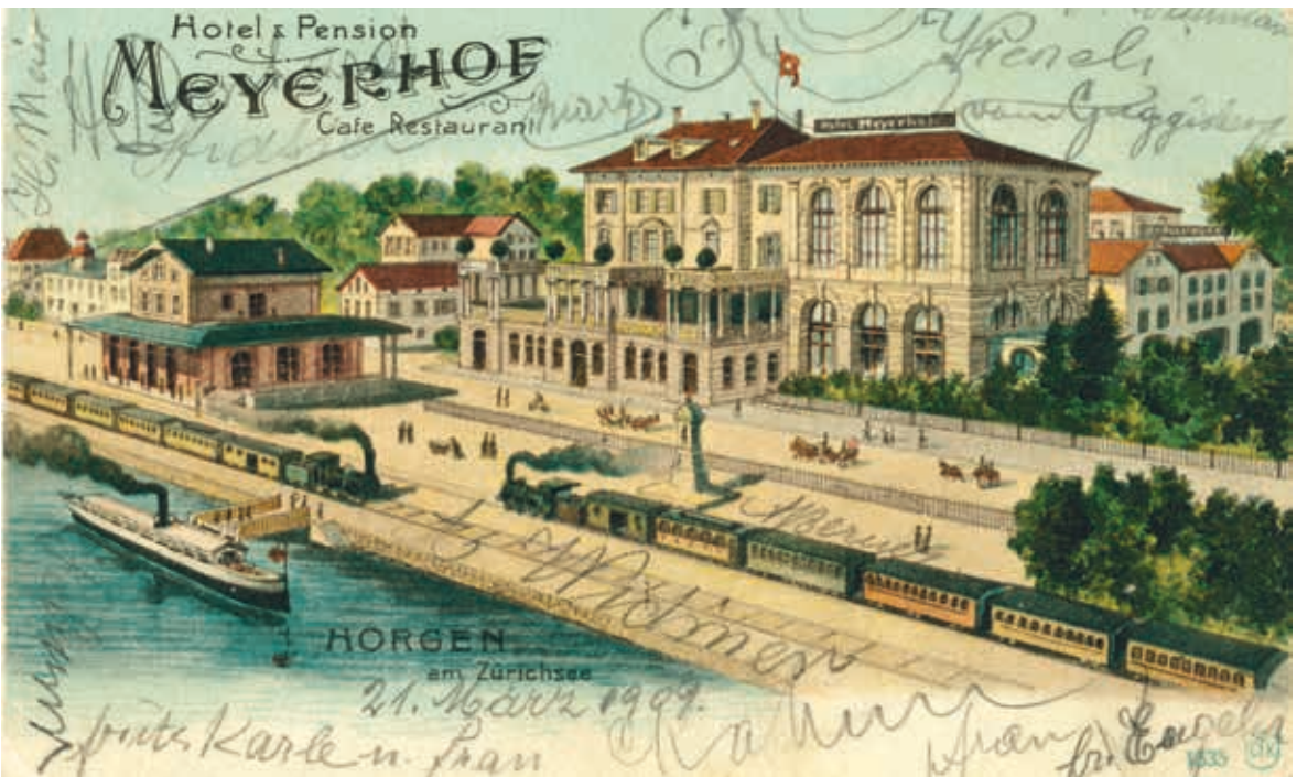
▲ Hotel Meyerhof, 1909. Die Werbeansichtskarte zeigt das 1842 erstellte Hotel mit dem Saalanbau von 1898. Neben den Kutschen sind die neuen Verkehrsmittel, der Bahnhof und die Dampfschiffstation abgebildet, wo nach 1905 die erste Wartehalle gebaut wurde.