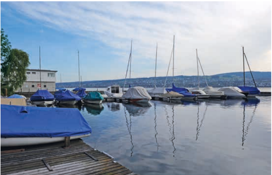
▼ Hafen Horgen Resasteg, 2012.

Die Abklärungen machen deutlich, dass die Nachfrage nach Bootsplätzen noch immer das Angebot übersteigt. In Horgen stimmt deshalb noch heute die Aussage, dass die Zusage für einen Bootsplatz sinnvollerweise vor der Anschaffung eines Bootes erfolgen sollte.