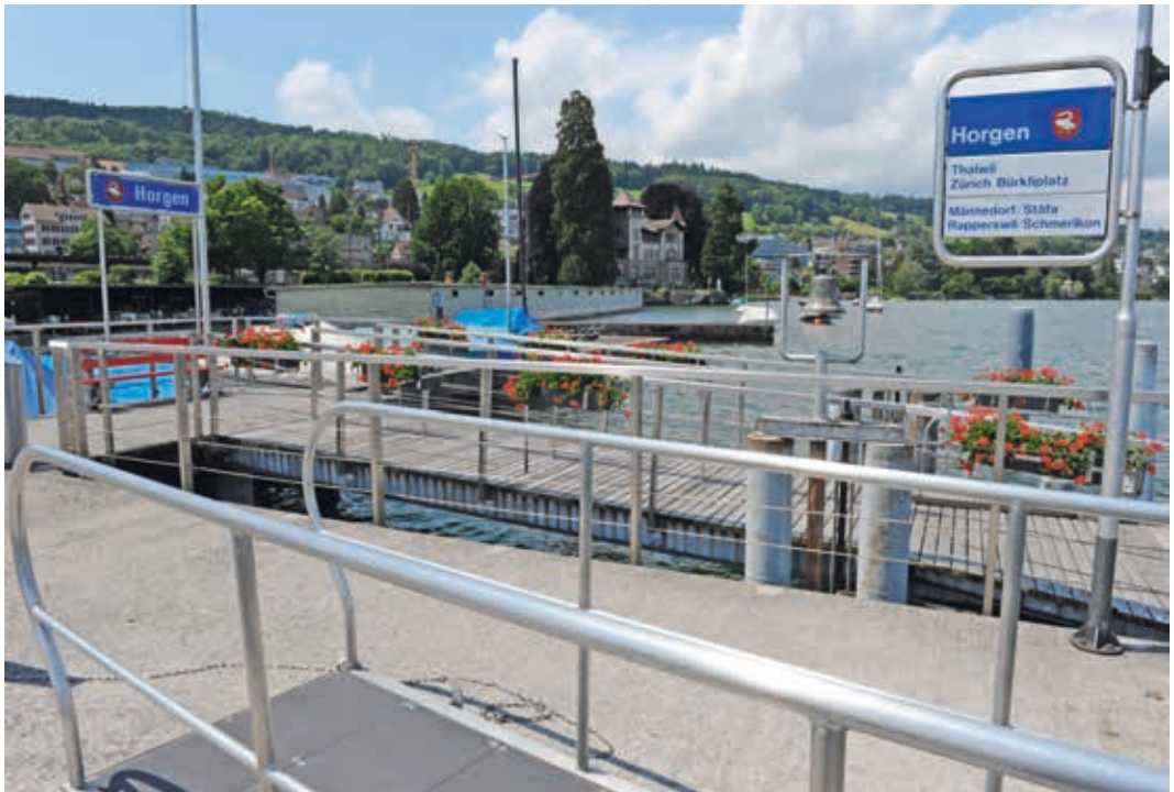
Titelbild Umschlag: Kursschiff auf der Fahrt nach Horgen, 2011.