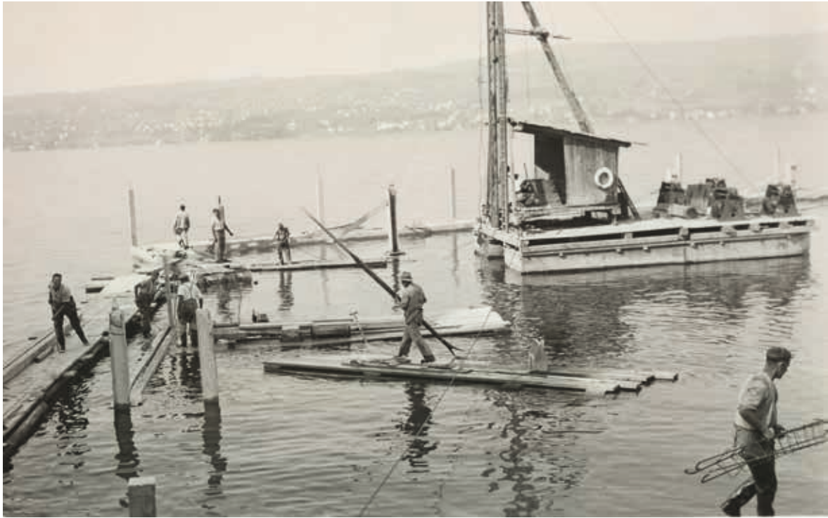
▲ Bau der Haab, 1937.