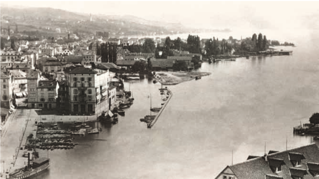
▲ Blick vom Turm des St. Peter gegen den See. Vor dem Bau von Quaibrücke, Bellevue und Quaianlagen, um 1860.