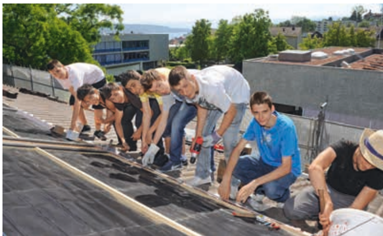
Sekundarschüler bauen eine Solaranlage.