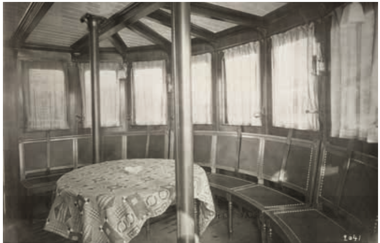
▲ Damenkabine (oben), Erste-Klasse-Salon (Mitte) und Raucherkabine (unten), des Dampfers Stadt Zürich, 1909. Als Generalunternehmer waren die Schiffbauingenieure von Escher Wyss auch für die Ausstattung der Kabinen und Salons verantwortlich.