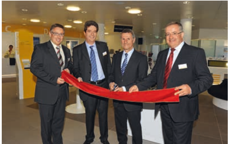
Eröffnung der Horgner Poststelle.