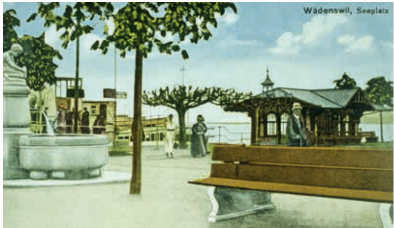
Schiffstation Wädenswil, 1920er-Jahren. Die Wartehalle im Jugendstil wurde 1906 gebaut und 1950 abgetragen.