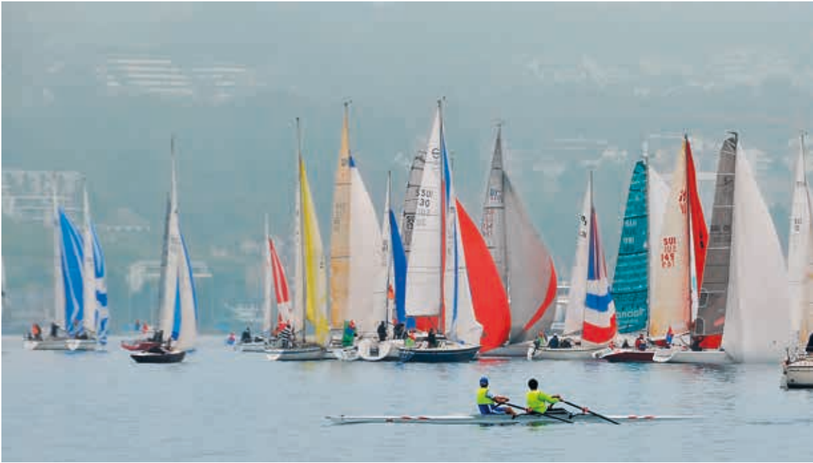
▲ Gemütliches Rudern vor hektischem Segeln, 2011.

Der Kreuzerpokal ist die abschliessende Regatta des Ruf-Langstreckencups. Zu dieser Rennserie gehören neun Regatten. Das Auftaktrennen ist jeweils der Schoggi-Cup der Seglervereinigung Kilchberg. Dann gibt es eine Auffahrtsregatta, eine Tag- und Nachtregatta, das Buchbergderby, den Halbinsel Au-Cup und drei Distanzfahrten, darunter die an Pfingsten durchgeführte Distanzfahrt Zürich-Rapperswil mit Start in Zürich-Tiefenbrunnen und Ziel in der Kempratner Bucht.