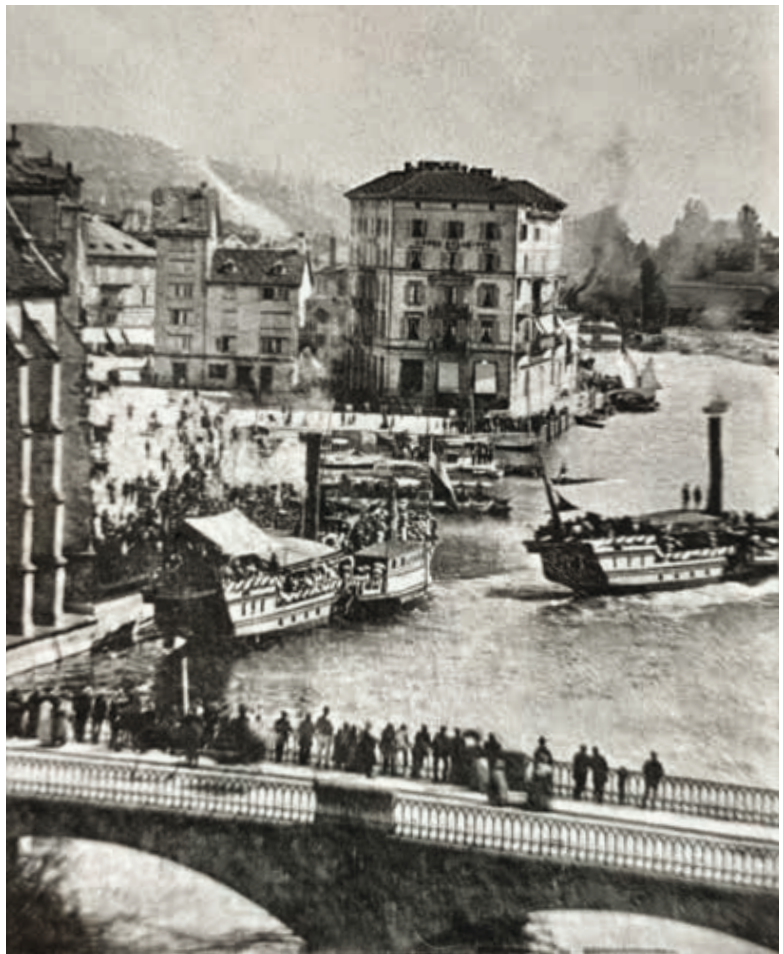
Zürcher Schifflände mit den Dampfern «Stadt Zürich I» und «Rapperswyl», um 1870. Im Vordergrund ist die Münsterbrücke und am linken Bildrand die Wasserkirche zu sehen. Die Schifflände liegt am stillen Ausflusstrichter der Limmat. 1882 begannen die Arbeiten für die Quaianlagen unter der Leitung von Arnold Bürkli. Nachdem 1884 die Quaibrücke eröffnet wurde, konnten die Schifflände oberhalb der Wasserkirche und die anderen Anlegestellen an der Limmat von Dampfschiffen nicht mehr angefahren werden.

Lebensmitteln aus der Umgebung angewiesen, da die Zürcher Bauern den Bedarf allein nicht zu decken vermochten. Daran beteiligten sich bereits im frühen 16. Jahrhundert die Bauern aus den Seegemeinden, die ihre Erzeugnisse im eigenen Schiff nach Zürich ruderten. Die Schifffahrtsrechte verlangten vorerst noch, dass ein von der Schiffsleutezunft nicht anerkannter Schiffsmann nur seine eigenen Waren an den städtischen Wochenmarkt führen durfte. Die Arbeit der Marktfahrer war aufwendig, und bald übertrugen die Gemeinden einem berufsmässigen Schiffsmann den gemeinschaftlichen Schiffsdienst. Mit den grossen Ruderschiffen beförderten sie, bei Wind unterstützt von Segeln, neben den Gütern auch Personen nach Zürich. Die Arbeit wurde auf mehrere Schiffsleute aufgeteilt, die für bestimmte Waren wie beispielsweise Briefe, Geldsendungen, Vieh, rohe Häute, Felle, Butter und Käse das Transportmonopol erhielten.