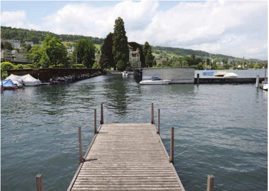
▲ Horgner Bootssteg mit Blick auf die «Seerose», 2012.