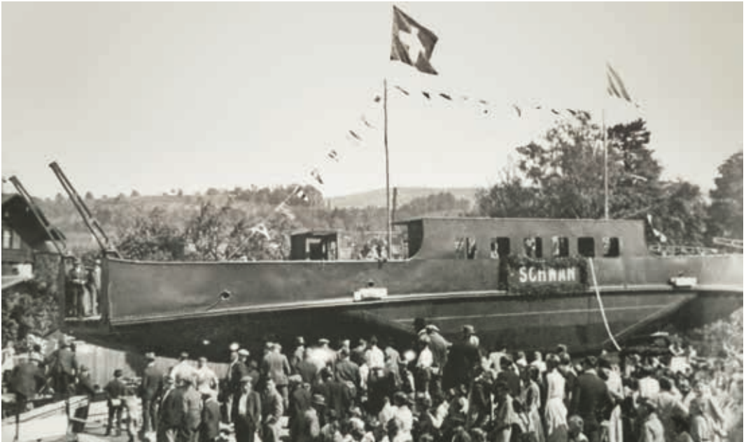
▲ Stapellauf der Fähre Schwan I (noch ohne Aufbau) in Ober- meilen, 20. Mai 1933.