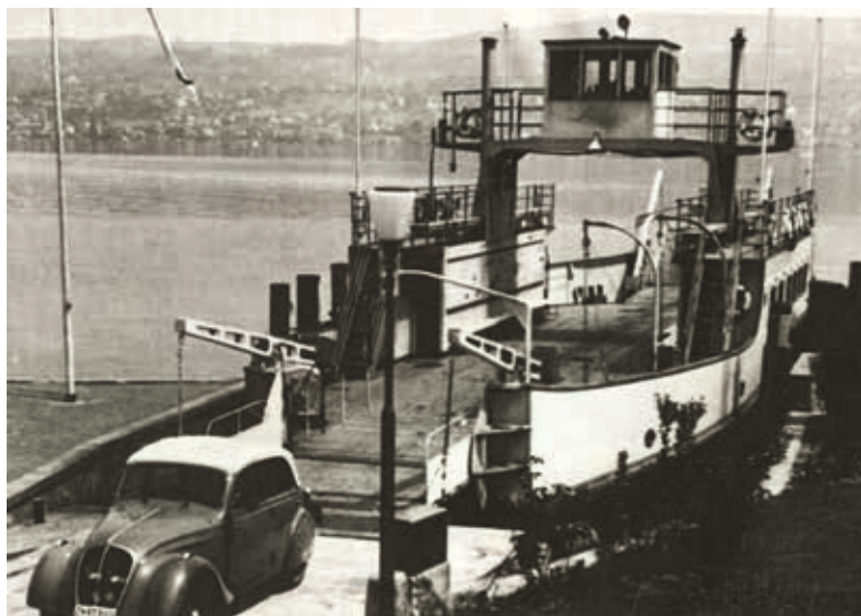
Die 1932 gegründete Zürichsee-Fähre Horgen-Meilen AG nahm ihren Betrieb mit dem «Schwan I» am 4. November 1933 im Halbstundentakt auf.

Der Tanklastwagen kommt auf die Fähre. Während der Hinfahrt wird der eine Tank gefüllt, während der Rückfahrt der andere.