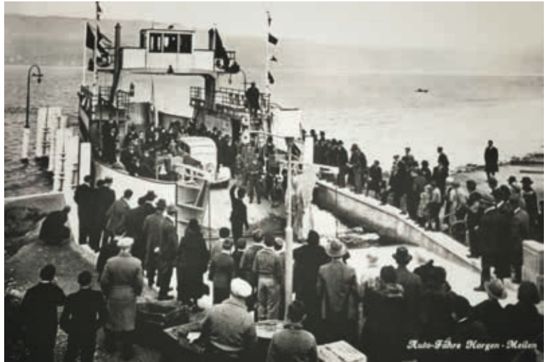
Auto-Fähre Horgen-Meilen, Postkarte von 1935.