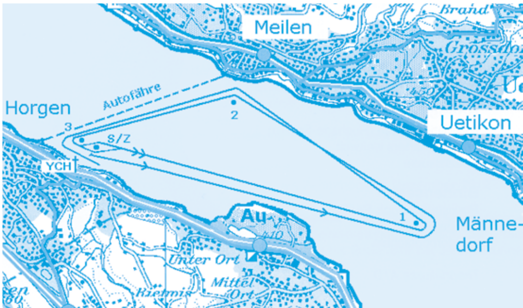
▲ Kurs der Kreuzerpokal-Regatta, 2011.

Jedes Jahr im September ist Horgen der Hauptschauplatz einer farbenfrohen Segelregatta. Zur Austragung kommt die Kreuzerpokal-Regatta, die den Abschluss des sogenannten Ruf-Langstreckencups bildet. Bis zu 90 Schiffe in verschiedenen Kategorien nehmen an der Regatta teil. Start und Ziel befinden sich beim Clubhaus des 1968 gegründeten Yacht-Clubs Horgen, der die Regatta organisiert.