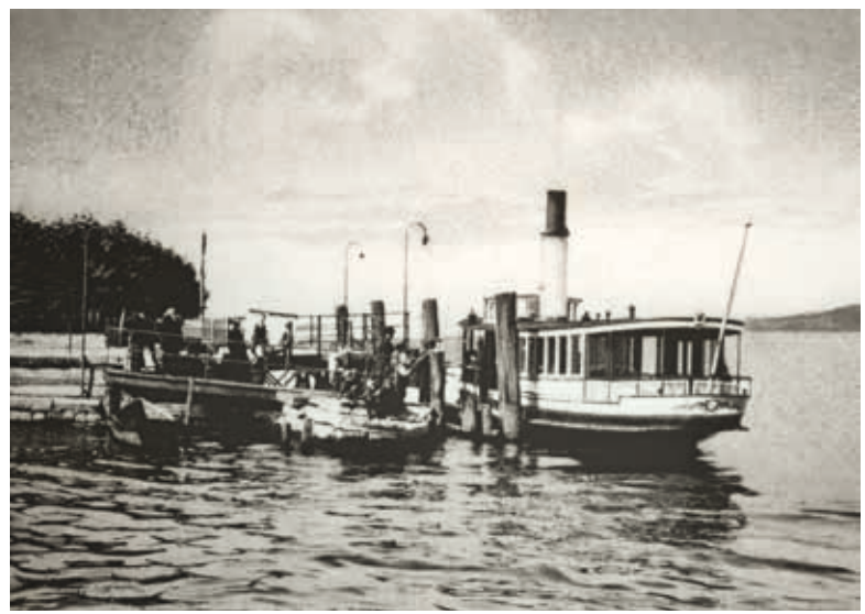
◀▶ Dampfschiffsteg Horgen, um 1920. Die Schiffswartehalle war mit ihrem markanten Dach und dem Dachreiter von weither erkennbar.

In Horgen entstand zwischen 1905 und 1920 an der Schiffsstation beim Bahnhof die erste, aufwendig gestaltete Schiffswartehalle, die nach 1931 wieder abgetragen wurde. 1994 wurde für die Schiffspassagiere gegenüber dem Bahnhof eine einfache offene Wartehalle aufgestellt.