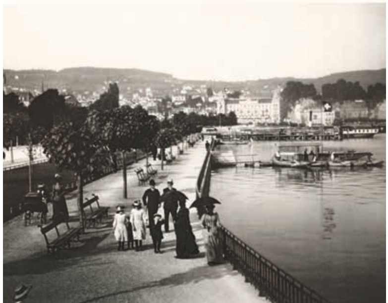
Im Juli 1887 wurden die Quaianlagen eingeweiht. Der Bau war eine der grossen städtischen Arbeiten, die unter der Leitung Arnold Bürklis ausgeführt wurden, um 1890.