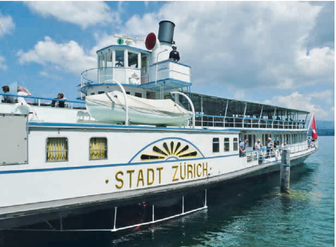
▲ Dampfschiff Stadt Zürich, 2011.