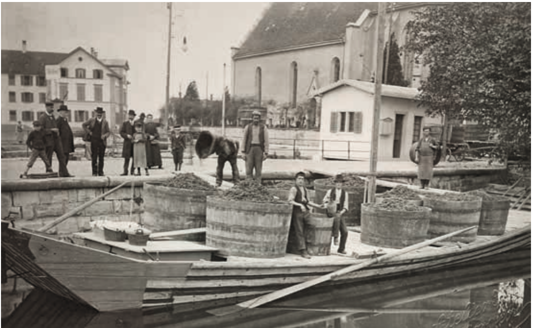
▲ Schiffswartehalle Meilen, 1906. Das öffentliche Wartehäuschen wurde 1906 gebaut und 1930 durch die heutige Wartehalle ersetzt.

In Männedorf wurde 1856 neben der Gemeindehaab ein Landungssteg für Dampfschiffe gebaut. 1870 wurde das erste Wartehäuschen erstellt, und 1915 folgte der Ersatzbau. Seit einem Umbau dient der schmucke Kleinbau von 1915 heute einem Gastronomiebetrieb. Die Schiffswartehalle Männedorf ist der letzte Zeuge der Baugattung aus dem frühen 20. Jahrhundert am Zürichsee.