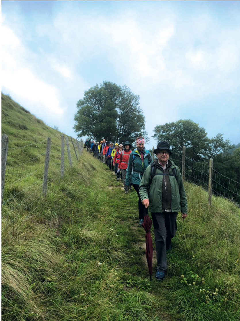
Die Wander-Pilgergruppe der Reformierten Kirchgemeinde Kilchberg unterwegs von Rüeggisberg nach Schwarzenburg.