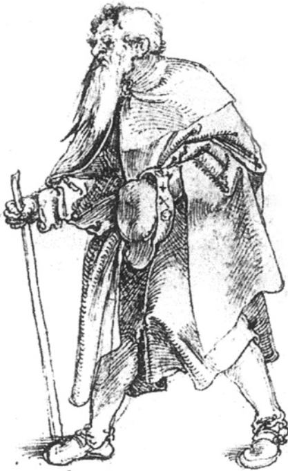
Federzeichnung eines Pilgers aus dem Jahr 1510.

Nach der Chronik des Paters Odilo Ringholz 5) hatte der spätere Heilige Meinrad die Einsamkeit gesucht und sich im Jahr 829 in einer Klausnerhütte auf dem Etzelpass, wo heute die St. Meinradskapelle steht, niedergelassen. «Aber jetzt kam die Welt zu ihm, um sich an seinem Beispiel und Wort zu erbauen», berichtet der Chronist. Im finsternen Wald des Hochtals zwischen Etzel und den beiden Mythen baute er sich dann eine Kapelle und eine neue Behausung.