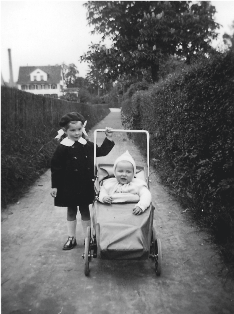
Vor zwei Generationen war der Weg im Wiesental, nahe der Grenze zu Rüschtikon, ein zum Spazieren einladender Ort.