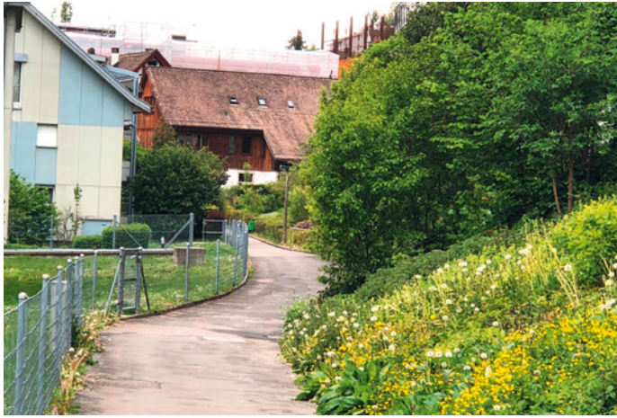
Kurz vor Wegende.