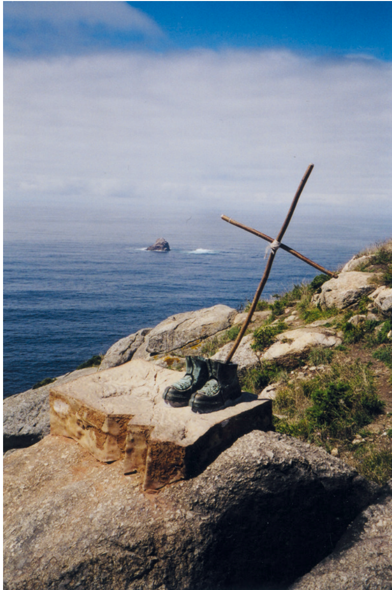
Das Denkmal mit dem Kreuz und den bronzenen Schuhen am Kap Finisterre ist ein Symbol für das Ende zahlloser, oft beschwerlicher Pilgerreisen über Santiago de Compostela hinaus zur nordwestlichen Spitze Spaniens.