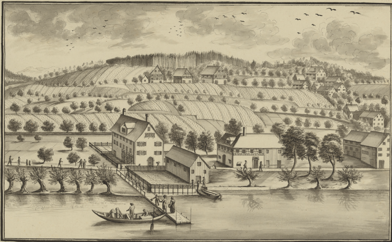
Der Pilgerweg beim Unteren Mönchhof im Jahr 1772, gezeichnet von Johann Jakob Hofmann. Die Umschlagseiten zeigen einen Ausschnitt aus dieser Zeichnung.