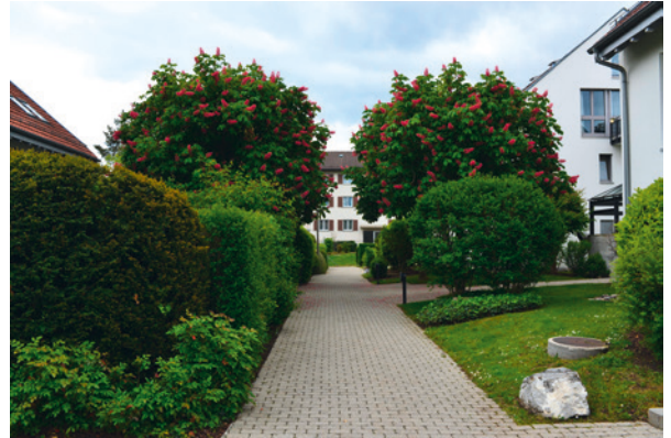
Rechts: Das Ende des Kilchberger Pilgerwegs im Wiesental heute.

Der Weg jenseits des Fabrikareals verfügt über einen gepflegten Bodenbelag, ist begrünt und verbreitert sich bis zu sieben Metern. Er führt durch eine moderne Überbauung mit Wohnhäusern und Gebäuden, die der Forschung und Entwicklung der Firma Lindt & Sprüngli dienen. An der Gemeindegrenze zu Rüschtikon endet er abrupt an der Stelle, wo die Rotfarb-Überbauung quer über dem historischen Pfad steht.