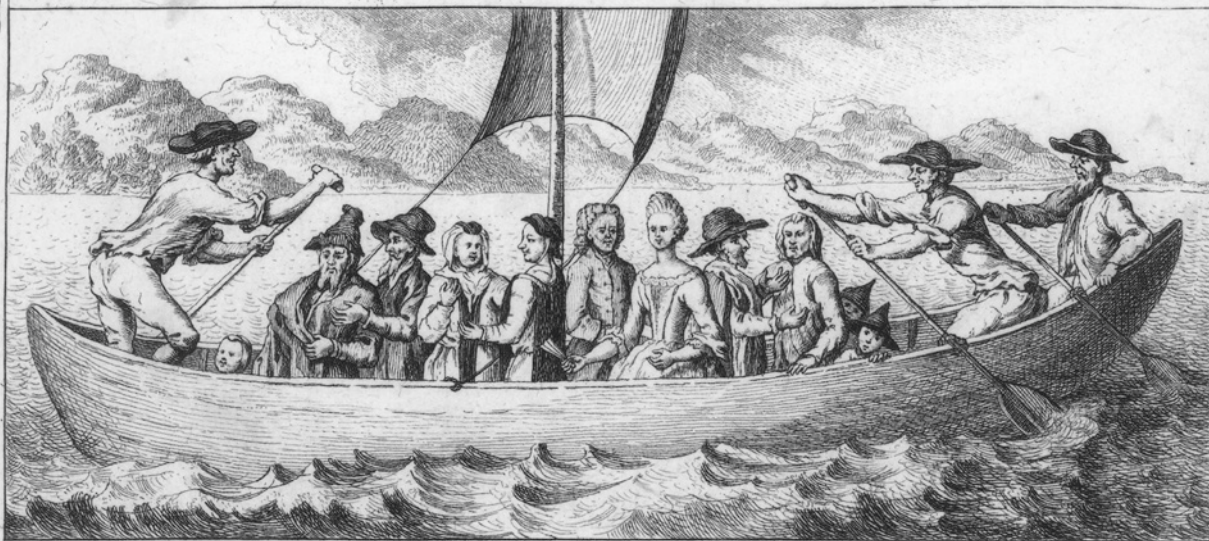
Das Pilgeri Schiff. Nach einem sehr alten Gemählde, so an einem Haus an der oberen Schiffländi in Zürich angemahlt ist.

Undatierter Kupferstich, Ortsmuseum Kilchberg.