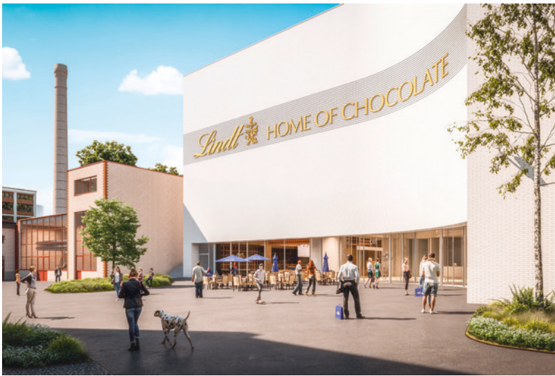
Der Schokoladenplatz liegt zwischen der bestehenden Konzernzentrale und dem Home of Chocolate. (Visualisierung Lindt & Sprüngli).