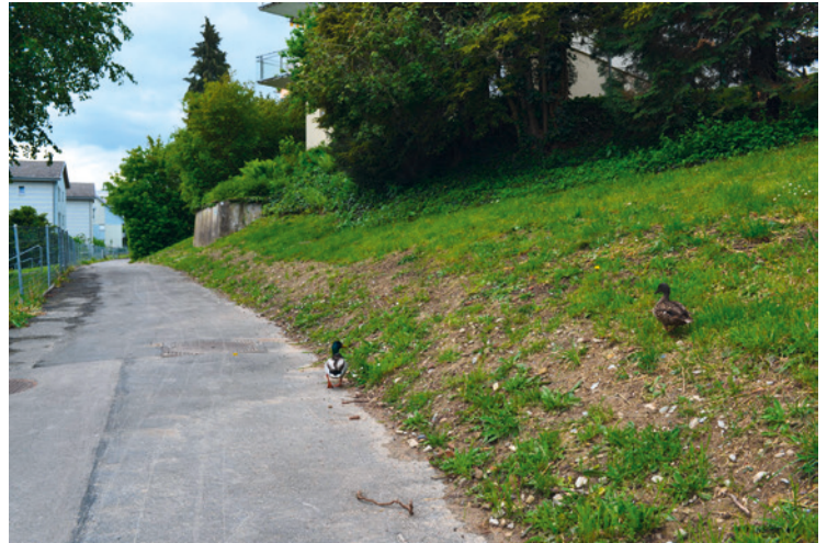
Der alte Weg nach wenigen Schritten.

Wer den Kilchberger Pilgerweg sucht, findet dessen Anfang nicht weit von der Schiffstation Bendlikon. Schräg gegenüber der ehemaligen Trotte, wo die Dorfstrasse von der Seestrasse abbiegt, steht eine kleine Tafel mit dem Hinweis «Pilgerweg». Dort beginnt ein schmaler, asphaltierter Fussweg, der – mit leichten Krümmungen – parallel zur Seestrasse nach Süden verläuft.