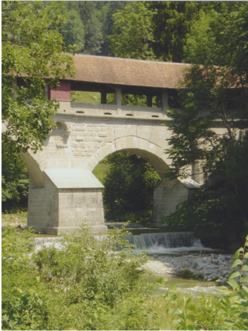
Die Tüfelsbrugg über die Sihl am Etzel wurde 1117 gebaut und seither mehrmals erneuert und restauriert.

Das Kloster Einsiedeln – Ziel zahlloser Wallfahrer, 2013.