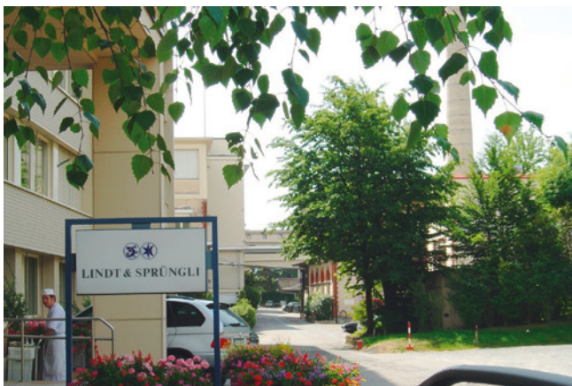
Eine Aufnahme aus dem Jahr 2003 zeigt, wie sich der Pilgerweg früher von der Schoorenstrasse aus Richtung Rüschlikon öffnete.