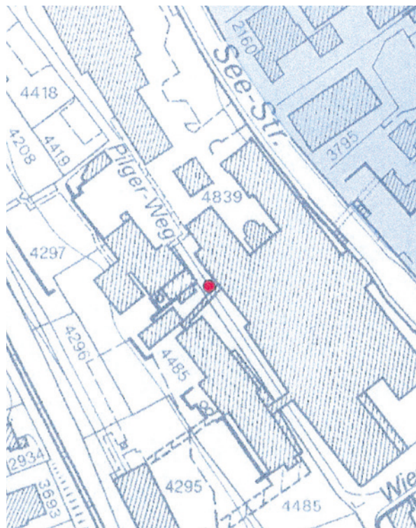
Der Ort der Probebohrung der Kantonsarchäologie vom 3. Juni 2017.

Ein Hinweis, dass die kantonalen Behörden den Kilchberg Pilgerweg weiterhin schützend beobachten, besteht darin, dass die Kantonsarchäologie am 3. Juni