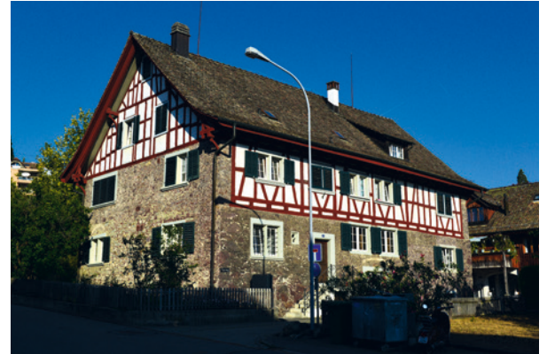
Den Abschluss des noch vorhandenen alten Pilgerwegs markiert das prächtige «Pfisterhaus».