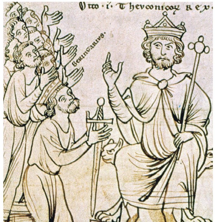
Im Jahr 965 vermachte Kaiser Otto I. der Grosse (912–973) dem Kloster Einsiedeln eine grosszügige Schenkung, die auch die Insel Ufenau einschloss. Aus alten Urkunden schliesst der Historiker Odilo Ringholz, dass sich Otto I. und seine Gemahlin Adelheid anlässlich einer Reise nach Chur nach Einsiedeln begaben. (Bild aus der Weltchronik Ottos von Freising, um 1200, Wikipedia).

Auf ihrem Weg folgten die Pilger Wegkreuzen, Bildstöcken, Kapellen, Kirchen und Klöstern; für Erfrischung und Unterkunft sorgten Tavernen und Gasthäuser. Viele, die zur Andacht beim Marienheiligtum zogen, erfüllten ein Gelübde; andere waren von materieller Not oder spiritueller Bedrängnis getrieben oder flohen vor Krieg,