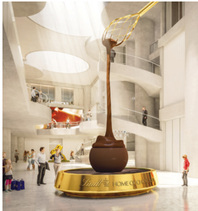
Eine besondere Attraktion im Home of Chocolate wird der acht Meter hohe Schokoladenbrunnen. (L & S).

tungsratspräsident der Firma Lindt & Sprüngli und Stiftungsratspräsident der Lindt Chocolate Competence Foundation. 2)