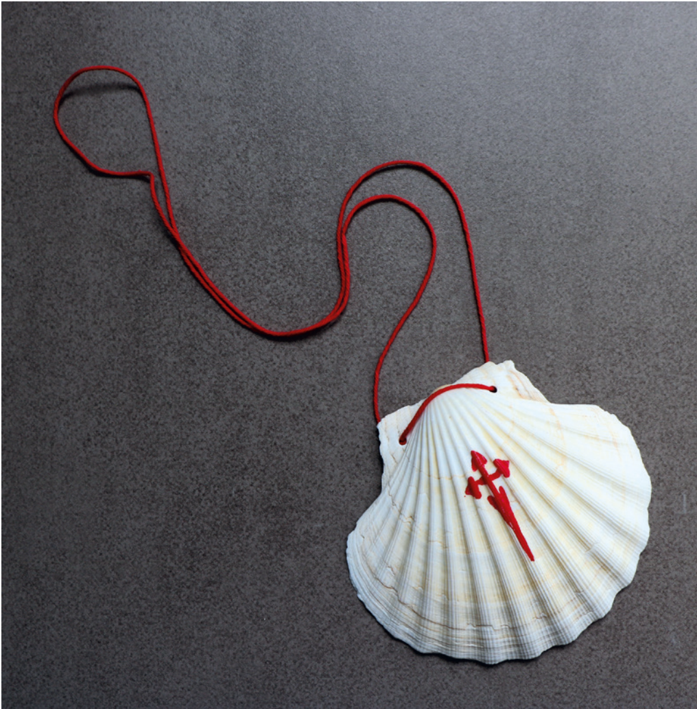
Diese Jakobsmuschel – das Signet der Pilger – hat der Autor dieser Arbeit bei einer Velo-Fahrt auf dem Jakobsweg durch Nordspanien in Santiago de Compostela erworben.

und dick wie die alten Eichen sind, viele davon beugen sich ins Wasser hinein und geben dem Badenden den kühlsten Schatten. Von da an gingen wir weiter, immer am See, niedliche Häuser lagen uns zur Rechten, Weinberge erhoben sich über die Häuser und über die Weinberge hohe Gebirge.»