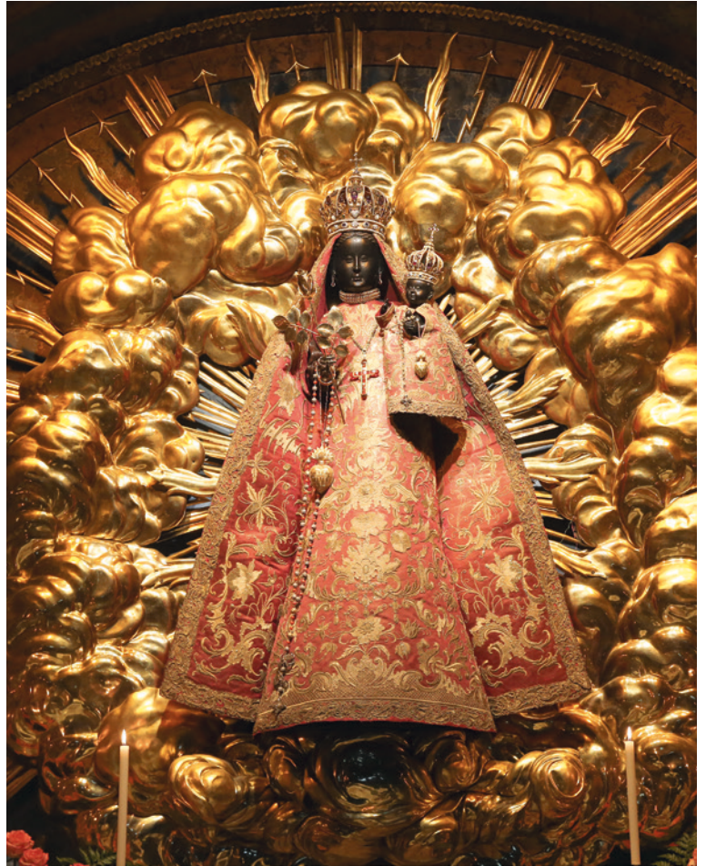
Ziel zahlloser Pilger ist die «Schwarze Madonna» in Einsiedeln.