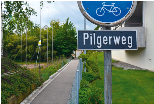
Heute präsentiert sich der Zugang zum alten Pilgerweg in Bendlikon, beim Beginn der Dorfstrasse, ganz unauffällig.