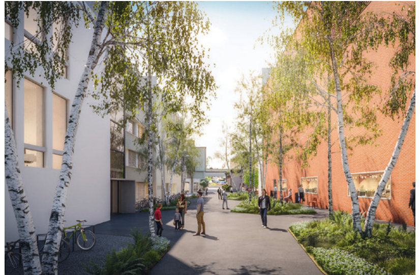
Der Pilgerweg nimmt auf diesem Abschnitt neue, ansprechende Formen an. (L & S).

Es wird erwartet, dass sich ab der bevorstehenden Eröffnung jährlich 350 000 interessierte Besucherinnen und Besucher hier einfinden werden, davon fast ein Drittel aus dem Ausland. So wird der ehemalige Pilgerweg auf dem Abschnitt des Werkgeländes neu belebt, was ihn in moderner Weise aufwertet.