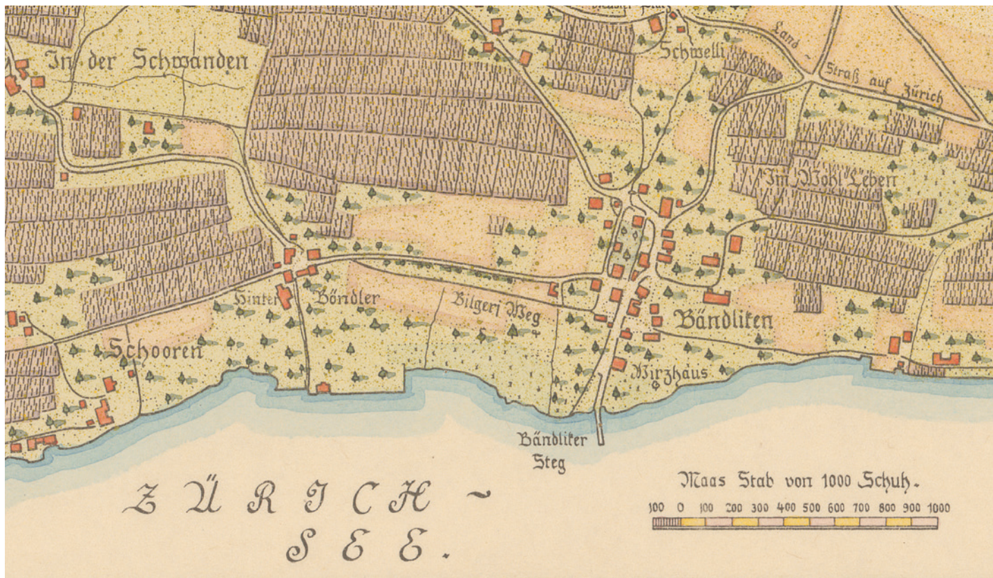
Der Ausschnitt aus dem Kilchberger Zehntenplan von 1787 zeigt den «Bilgeri Weg», noch nahe am See, und die Alte Landstrasse.