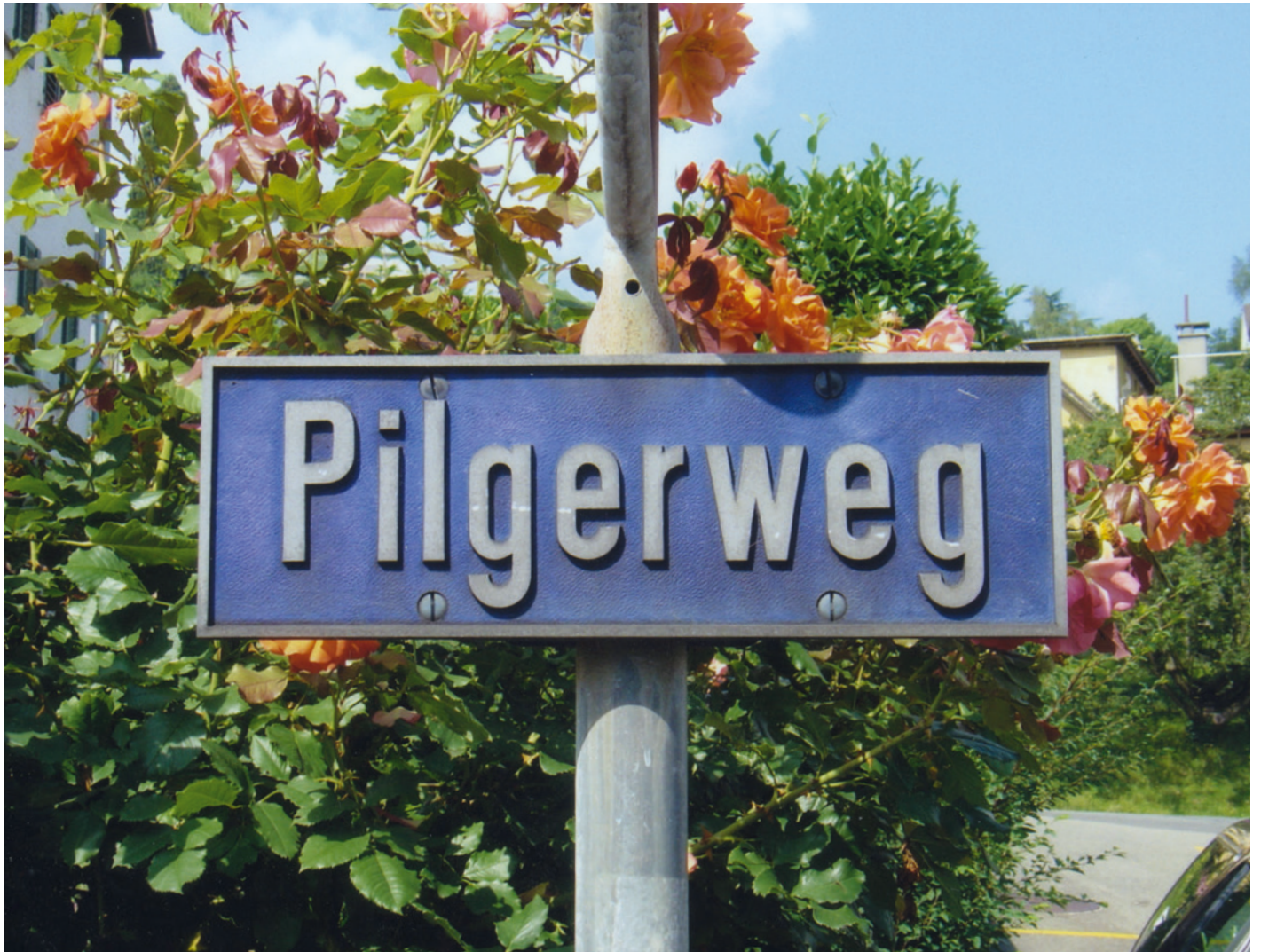
Die ehemalige Tafel beim Beginn des alten Weges (Aufnahme 2003).