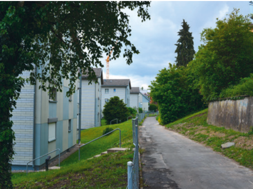
In neuerer Zeit hat sich die Umgebung des Wegs stark verändert.

Für viele Kilchberger – vor allem die Bewohner des Schooren-Quartiers und die Mitarbeiter der Firma Lindt & Sprüngli – bedeutet dieser Fussweg eine beliebte Verbindung zwischen dem Bahnhof und der Grenze zu Rüschlikon. Sie erübrigt den Benutzern den Umweg über die lärmige, verkehrsreiche Seestrasse.