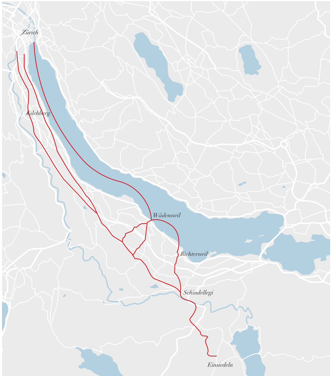
Die alten Pilgerwege von Zürich nach Einsiedeln.