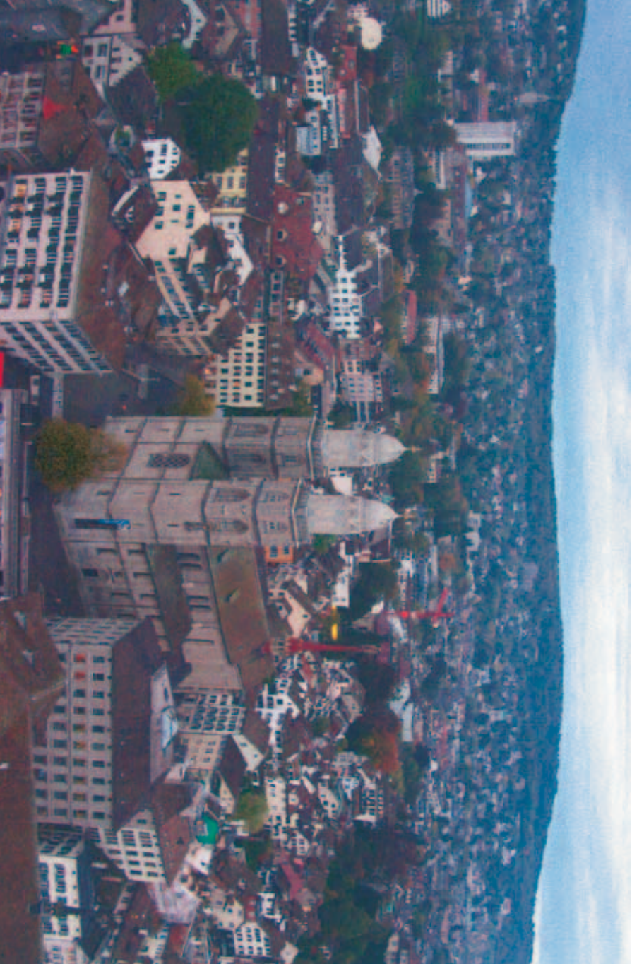
Aussicht von der obersten Gerüstplattform des Fraumünsterturms am 20. Oktober 2004