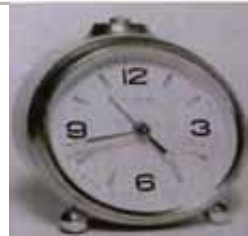
1969: Der Alarm 20.12. (Uhrzeit: 00:00:00)