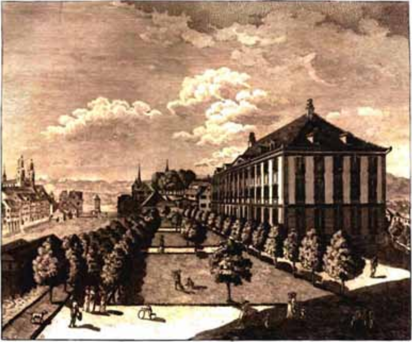
Das 1771 fertig gebaute Zürcher Waisenhaus Ansicht von 1810. Stich von Franz Hegi