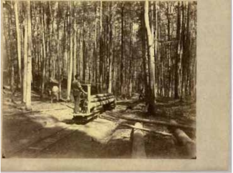
Auf stetig leichtem Gefälle wurde die Waideisenbahn, mit Langholz oder Scheiterholz beladen, per Schwerkraft bis zum Werkhof Sihlwald gefahren

Der Bau der Sihltalbahn (1892) erleichterte einerseits den Holztransport nach Zürich und führte unter anderem auch zu einer besseren Erschliessung des Waldes für erholungsbedürftige Städter und Städterinnen.