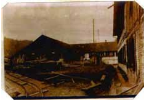
13. Sihlwald, Zurich, Switzerland, Aug. 17, 1918. A view showing treating plant for poles and posts. Wood is treated green with bark on. Bark peeled after treatment. The mill in the distance for making veneer for the Zurich market. This product is of two grades as to thickness. Veneer very thin chiefly made from spruce. The poles in the foreground have just been treated. The spruce piles on the left reserved for veneer.

Der Holzverarbeitungsbetrieb um 1918. Links die Schienen der Waldeisenbahn, die bis zur Sägerei (hinten links) führten. In der Mitte die Imprägnierungsanlage mit dem zu behandelnden Langholz. Ganz rechts die Dreherei!