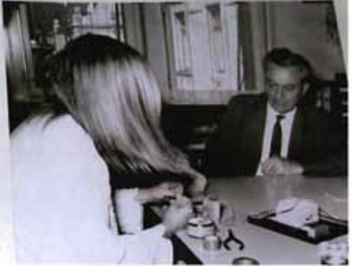
Ausschnitt aus der «Politisches Leben». Dokumentation des Erkennungsdienstes der Stadtpolizei über die Anschläge auf das Stadthaus und die Hauptwache Urania vom 25. Dezember 1969 und 37 Januar 1970