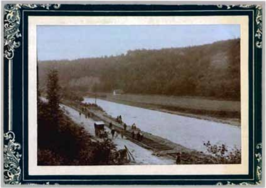
Bauarbeiter verlegen Schwellen und Schienen: Reparaturen am Trasse der Sihltalbahn bei Leimbach um 1890.