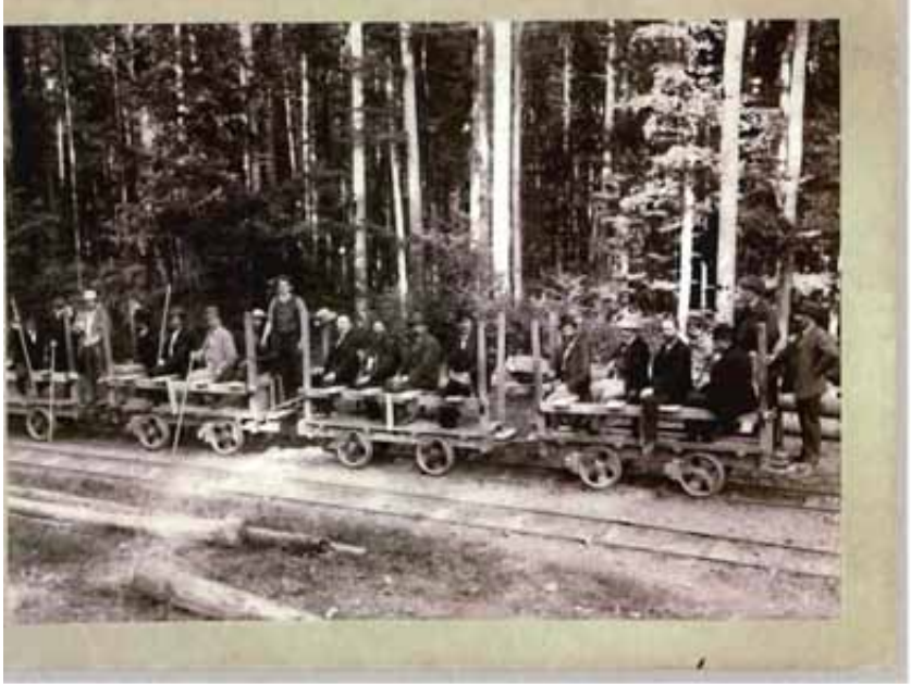
Mitglieder des Stadtrates beim Waldumgang mit der Waldeisenbahn (1886)

Seit der Gründung der Stiftung «Naturlandschaft Sihlwald» (1994) steht der Wald unter Schutz. Fortan wird er sich selbst überlassen und soll sich in Zukunft zu einer Naturlandschaft rückentwickeln.