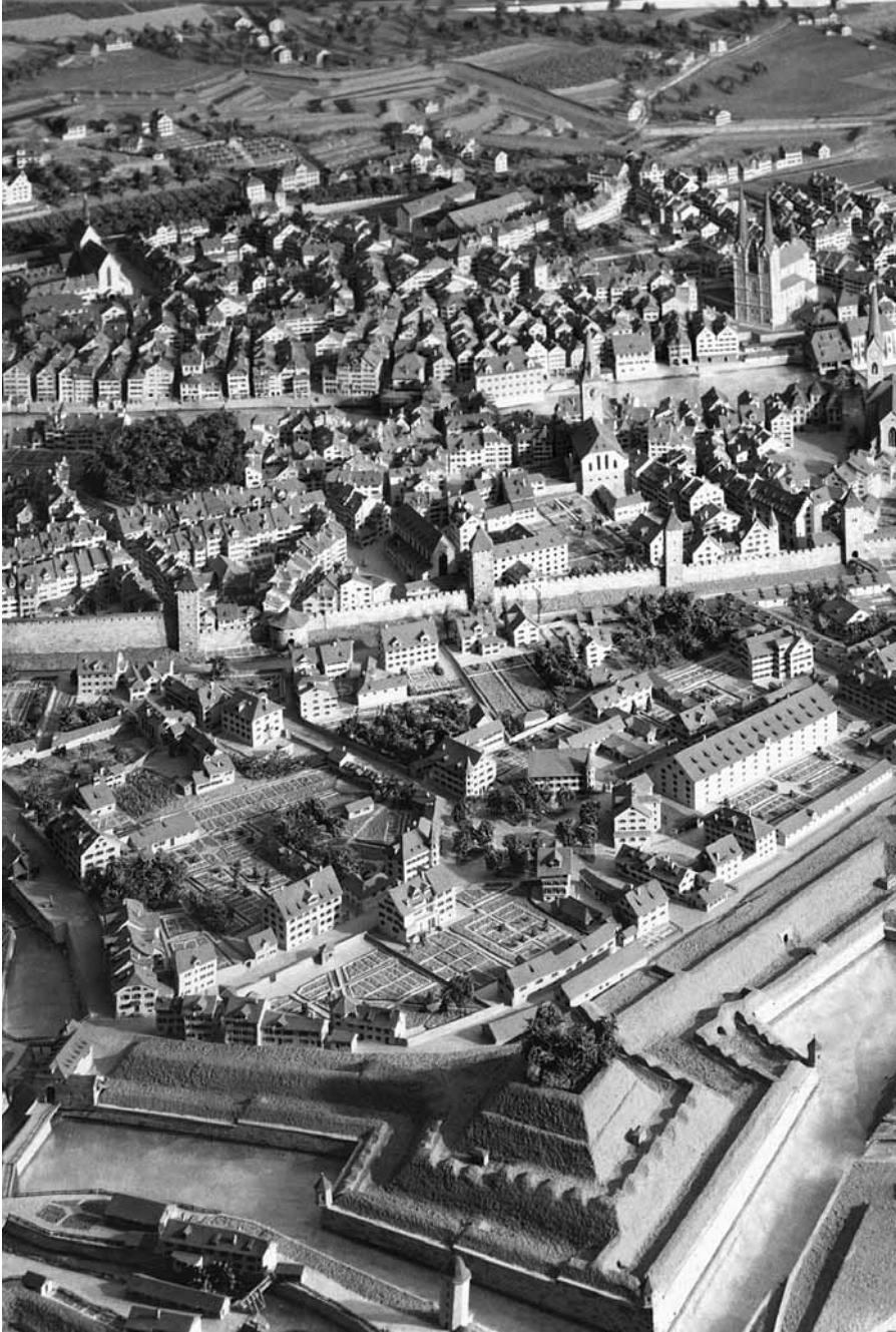
Stadtmodell von Hans Ferdinand Langmack