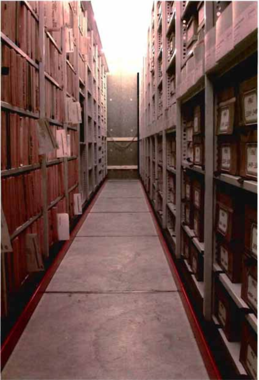
Dossiers der Amtsvormundschaft der Stadt Zürich mit Abhörbogen