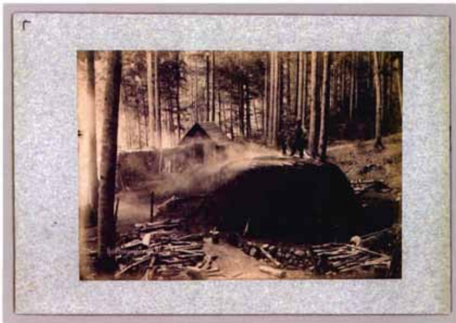
Der letzte Kohlenmeifer im Sihlwald im Jahre 1796.

Seit dem Mittelalter wurde der Sihlwald intensiv genutzt, was zum Kahlschlag weiter Teile des Waldgebietes führte. Erst ab 1830 wurden diese Gebiete wieder aufgeforstet und es wurde eine nachhaltigere Waldwirtschaft eingeführt, indem unter dem schützenden Schirm grosser Buchen junge Bäume nachgezogen wurden.