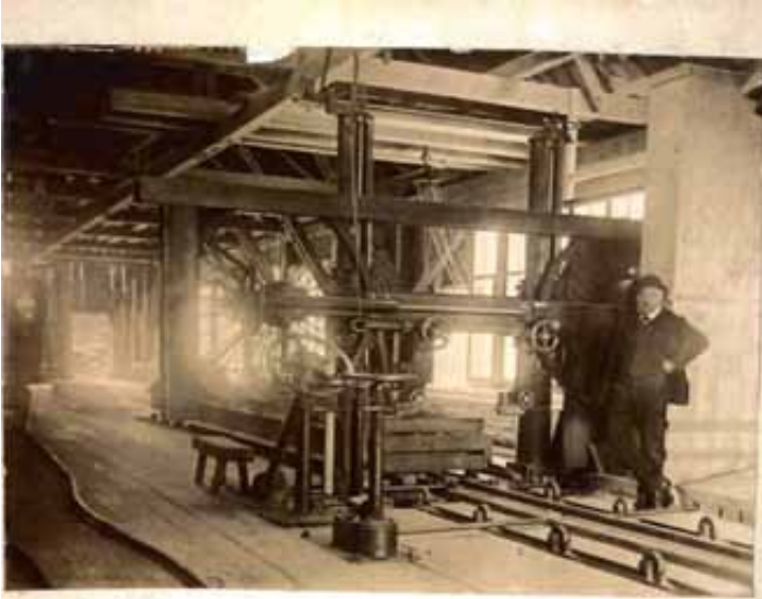
Eine Hofzontal-Bandsäge im Inneren der Sägerei (1914)

Von Orellis Nachfolger, Stadtforstmeister Ulrich Meister (1838-1917), modernisierte den Holztransport aus dem Sihlwald mit dem Bau einer 26 Kilometer langen Waldeisenbahn, die 1876 in Betrieb genommen wurde. Die Holzproduktion konnte auf diese Weise stark gesteigert werden.