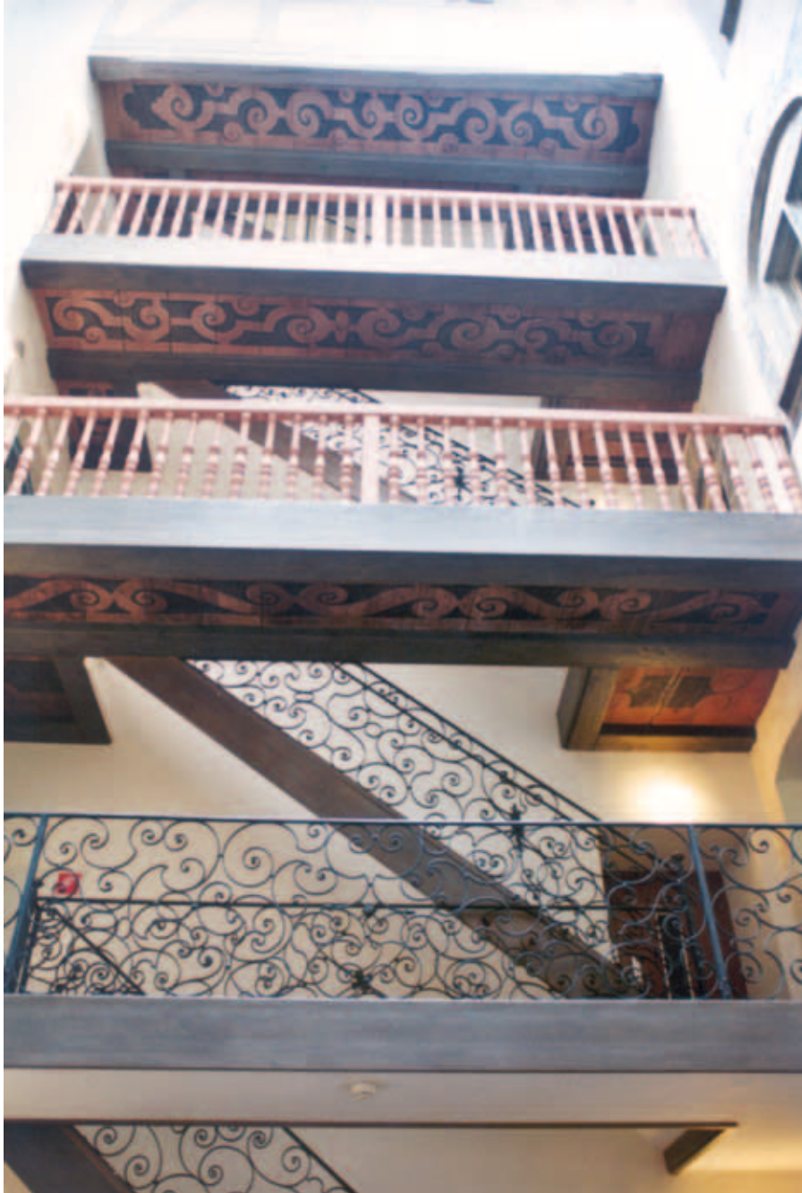
Untersichten der Treppenbalcone im Lichthof des Hauses zum Untern Rech