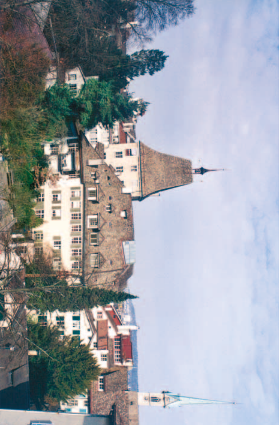
Haus zum Rech mit Gimmerturm und Predigerkirchum vom Obergericht