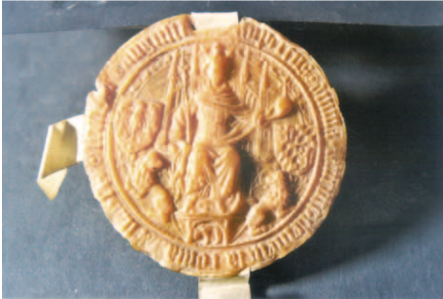
Königssiegel Ruprechts von der Pfalz an der Urkunde I.A. 273. von 1406

des Vorhelvetischen Archivs, wenn die Zeit bis zum Ende des 18. Jahrhunderts im Vordergrund steht. Lokalgeschichtliche Hinweise findet man in den Archiven der 1893 und 1934 eingemeindeten Vororte. Sozialgeschichtlich ausgerichteten Studierenden können Abhörbogen der Amtsvormundschaft gezeigt werden, den Angestellten des Stadtforstamtes Pläne der Stadtwaldungen und Familienforschenden die Bürgerbücher, Pfarrbücher und Registerkarten der Einwohnerkontrolle. Neben den schriftlichen Archivalien besitzt das Stadtarchiv Münzen, Medaillen, Siegel und zahlreiche dreidimensionale Gegenstände. Dazu gehören Wahlurnen, alte Gewichts- und Längenmasse, die Hauptschlüssel der längst abgerissenen Stadttore und der Bombensplitter einer Haubitzengranate von der Beschiessung Zürichs im September 1802.