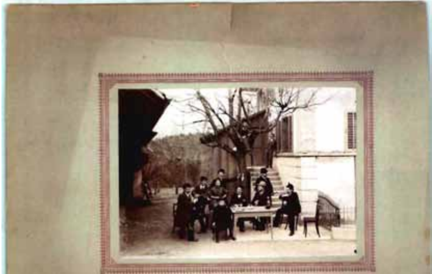
Ein Ausflugszie/ für Zürcherinnen und Zürcher: das Wirtshaus in Sihlwa/d um 1970.

Mit dem Eidgenössischen Forstpolizeigesetz wurde 1902 ein strenges Rodungsverbot eingeführt, das die Waldflächen in ihrer heutigen Ausdehnung sicherte. Ausserdem führte die abnehmende Wichtigkeit des Rohstoffes Holz zu einer graduellen Stilllegung des Forstbetriebes.