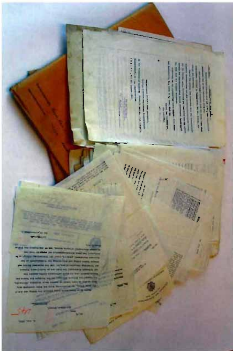
ANALYSIS OF THE DOCUMENTS RECEIVED ON 21-07-2019