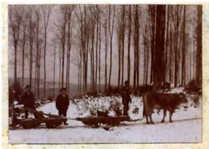
Die Wagen der Waldeisenbahn wurden mit Ochsen oder pferden den Hang hinaufgezogen (1920)