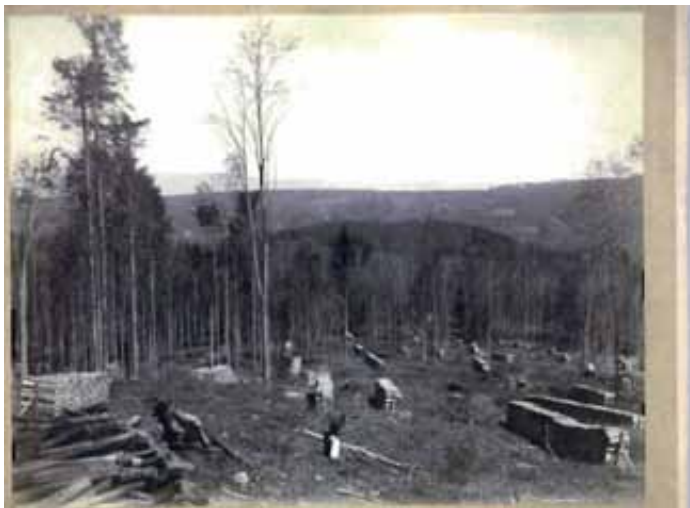
Rastende Wärdarbeiter während der Aufräumarbeiten nach der Schneedruckkatastrophe von 1895.