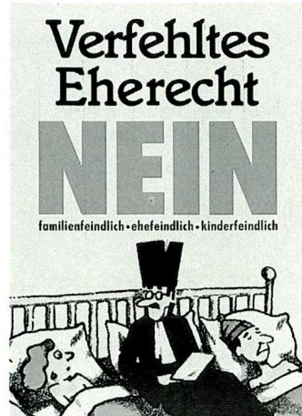
Zwei Abstimmungsplakate zum neuen Eherecht 1985