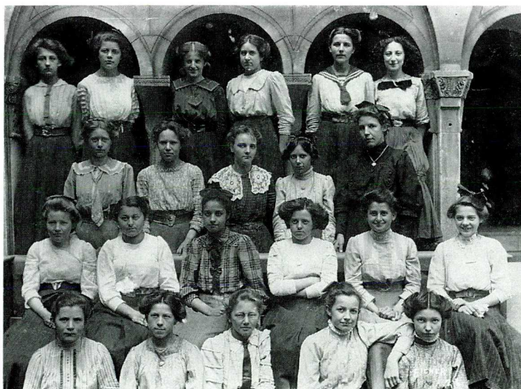
Handelsklasse der Töchterschule im Hof des Grossmünsters 1911/1912

Dass Zürich als Universitätsstadt den Frauen vergleichsweise früh den Zugang zu höherer Bildung bot, hat sich mittlerweile herumgesprochen. Dennoch ist die Frage nach der Zürcher Mädchenbildung und die Geschichte der Töchterschule noch nicht in allen Teilen geschrieben, obwohl die Quellen dazu im Stadtarchiv sehr reich sind. Neben den Protokollen des Schulamtes, d.h. der Schulpflege, bzw. der Frauenkommission, sind es hier die