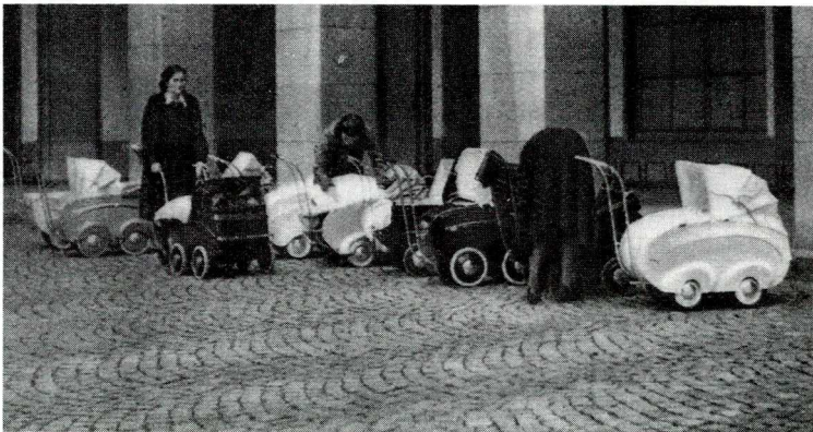
Vor der Mütterberatungsstelle 1945

Finanzamt: Einheiratungsgebühren 1839-1860.[Schachtel 3] V.C. c.16.