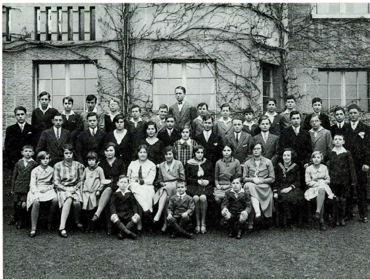
Kinder des Waisenhauses Sonnenberg 1930

Spezialarchive: Stiftung Wohnungsfürsorge für kinderreiche Familien. Protokolle und Akten 1924-1929. [Enthält Mietzuschläge an kinderreiche Familien 1923-] VII. 38.