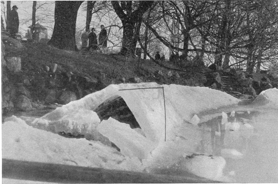
Abb. 1. Seeufer beim Zürichhorn am 7. März 1963. Durch die Eispressungen wurden die ufernahen Partien der Eisdecke gebrochen und dachfirstartig aufgestellt.

peratur lag in dieser Zeit durchschnittlich um 6^{\circ} unter Null und die Eisdicke war immer noch im Zunehmen begriffen. So bildete sich am 25. Februar durch Bruch und gegenseitiges Aufstellen der Ränder ein Eiswall im Gebiet zwischen Zürichhorn und Tiefenbrunnen. Am 26. wurde er noch verlängert und um einen zweiten, parallelen