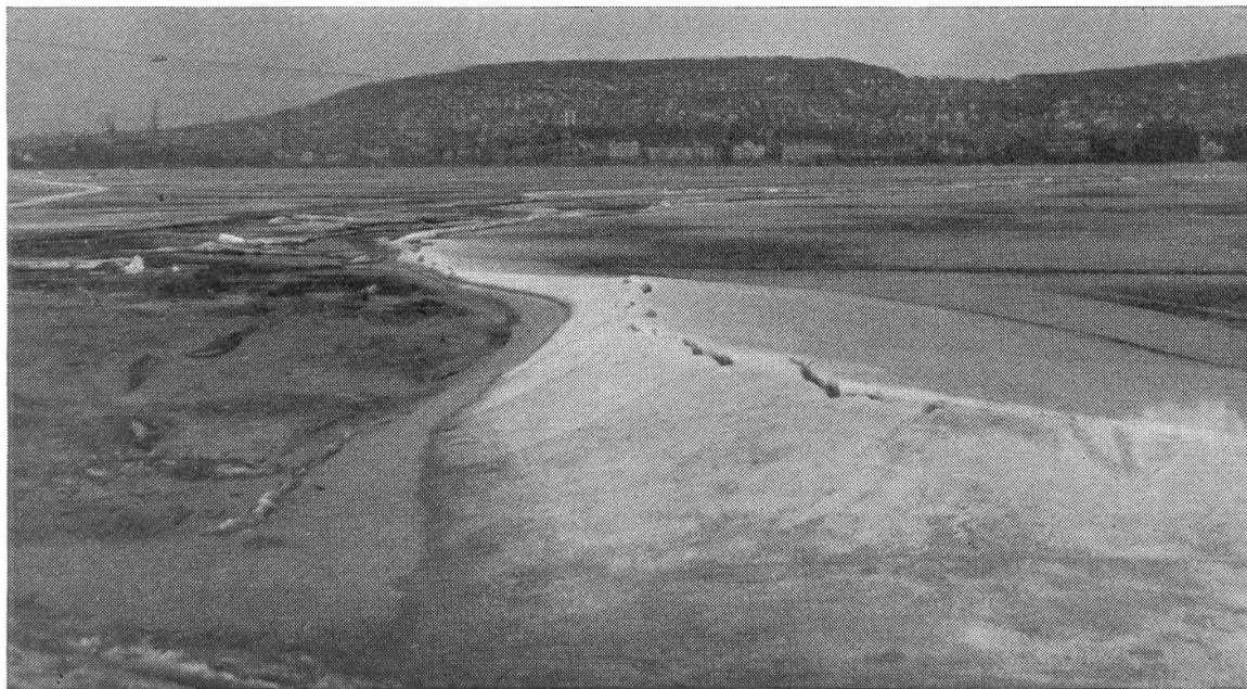
Abb. 2. Blick von der «Saffa»-Insel gegen die Stadt. Die Bruchzone zieht sich in einem weiten Bogen über das Seebecken gegen das Zürichhorn. Aufnahme: 8. März 1963.