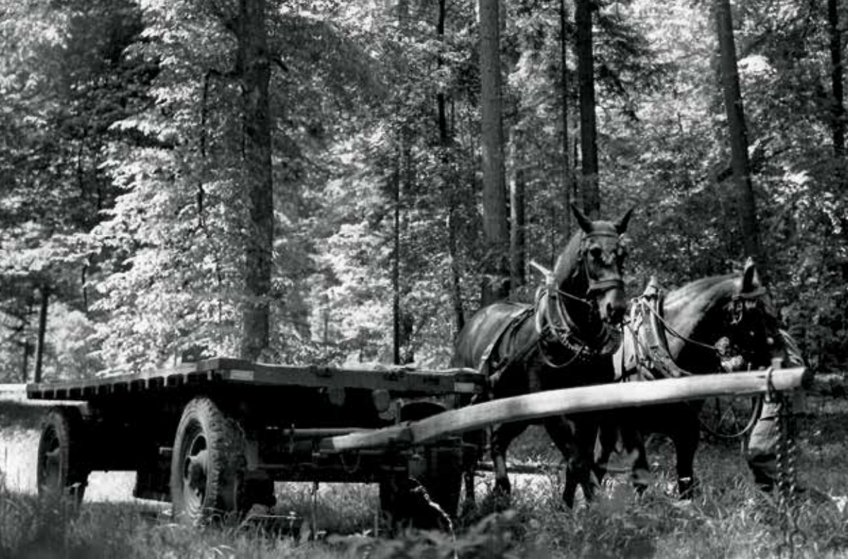
Pferdegespann beim Einsatz im Honeretwald.

Jahrhunderte lang war man im Grunde der Ansicht, dass der Wald einfach nur da sei, um daraus Holz zu holen. Nach der Ausscheidung von 1847 jedoch ging der Wald in den Besitz der Holzcorporation Dietikon über, und es entwickelte sich schnell ein grosses Interesse, den Wald gut und rationell zu bewirtschaften. Man gelangte zur Einsicht, dass der Wald nicht nur wirtschaftliche, sondern auch ökologische Bedeutung hat und dementsprechend gepflegt werden muss. Kein Teilrechtsbesitzer wünscht sich heute den alten Zustand zurück, wo jeder nach Belieben einen Kahlschlag machen und so Erdbeben verursachen oder bei grossen Stürmen eine Angriffsfläche öffnen konnte, die weite Waldstrecken der Verwüstung anheimgaben.