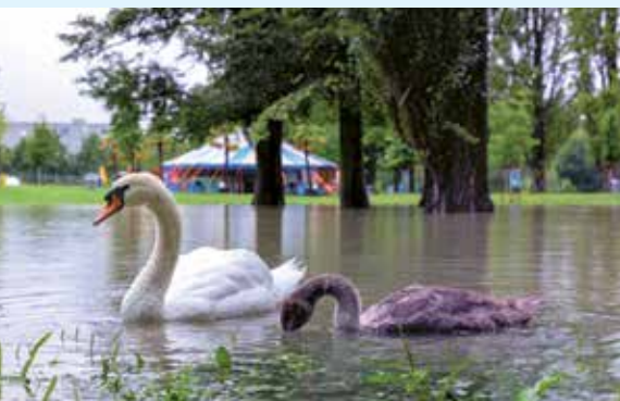
Nicht alle hatten Probleme mit dem vielen Wasser: Schwäne inspizieren die überflutete Allmend.

16. Land unter im Limmattal. Nach den vielen Regenfällen der letzten Tage ist die Allmend Glanzenberg überflutet. Die Limmatwege werden abgesperrt, Tiefgaragen und Kellerräume ausgepumpt, das EKZ muss abgeschaltet werden, bis sich die Situation wieder normalisiert, da sich das Holz vor dem Dietiker Kraftwerk in der Limmat staut. Mit der Stadt Zürich, wo ganze Waldgebiete geknickt wurden,