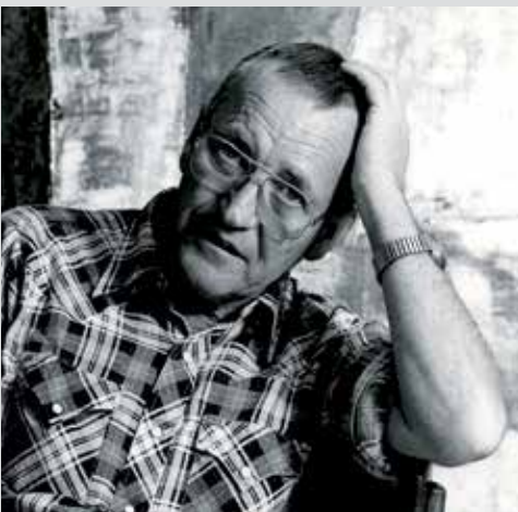
Josef Staub, Bildhauer und Maler

Ebenso wenig bekannt sind seine Gemälde in Ölfarbe auf Leinwand, für die er 1957 und 1969 mit dem Eidgenössischen Kunststipendium und 1958 mit dem Kiefer-Hablitzel Stipendium ausgezeichnet wurde.