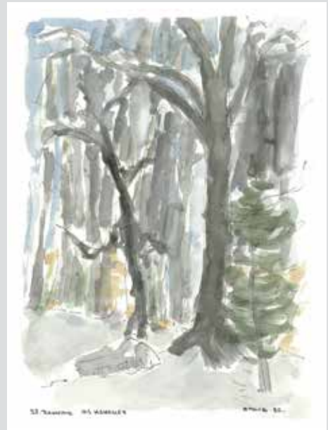
Im Honeret, 1982