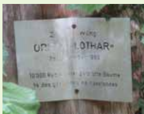
Erinnerungstafel an der Tobelbachstrasse

Der Dietiker Wald entwickelte sich zu einem natürlicheren Wald mit einer grösseren Artenvielfalt. O.M.