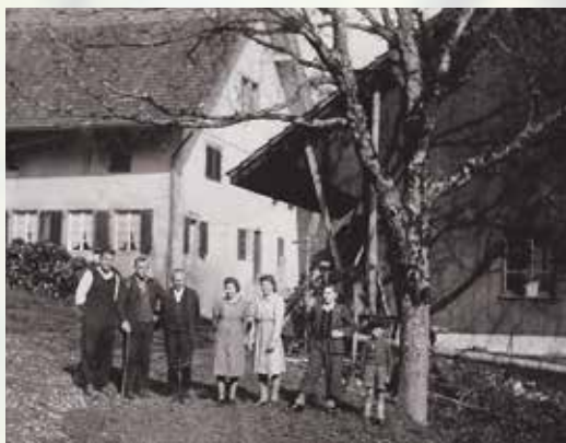
Der Bollenhof und seine Bewohner, ca. 1940.

1893 fasste die Gemeinde Dietikon im Gebiet Laubibrunnen nahe beim Bollenhof