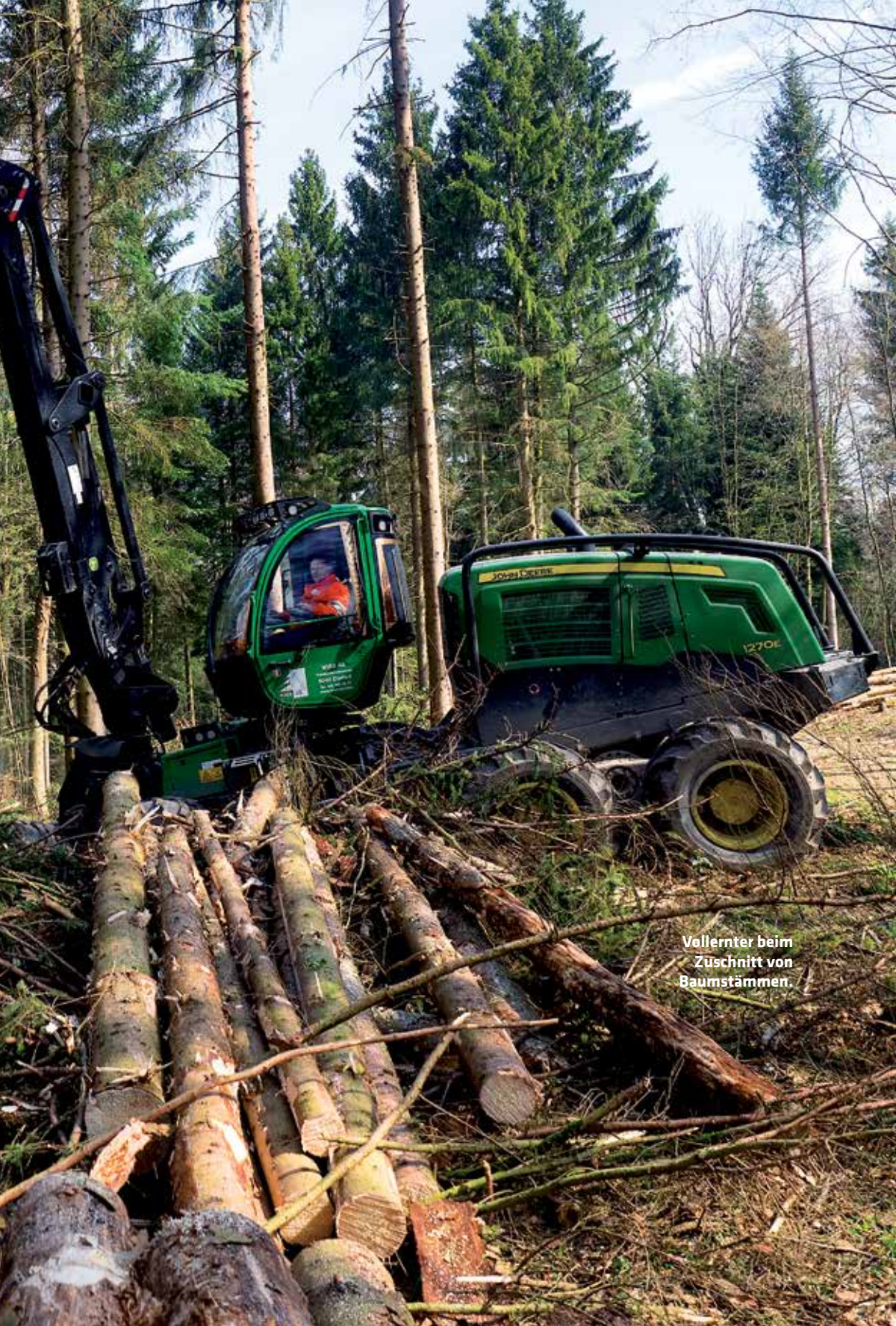
Vollerter beim Zuschneid von Baumstämmen.