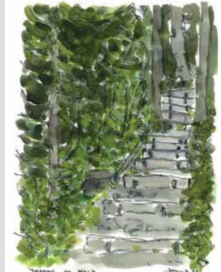
Treppe im Wald, 1982