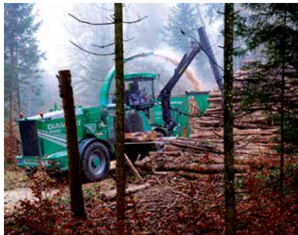
Energieholz wird zu Holzschnitzel verarbeitet.

Konfrontiert mit dieser wohl grössten uns alle betreffenden Herausforderung, dem Klimawandel, gilt es also mehr denn je, den Wald von heute fit zu machen für morgen – den Wald als Generationenprojekt der Zukunft zu verstehen. Wohl verstanden, der Wald allein ist bei Weitem nicht die Lösung des eigentlichen Problems, doch er kann uns dabei helfen. Denn mit Holz aus einer naturnahen, nachhaltigen Nutzung leisten wir einen wertvollen Beitrag, auf dem Weg zu einer möglichst CO 2 -neutralen Gesellschaft.