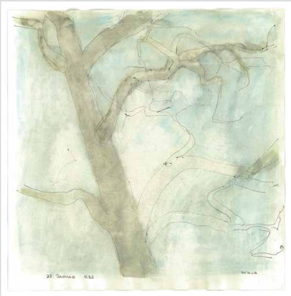
Im Honeret, 1982