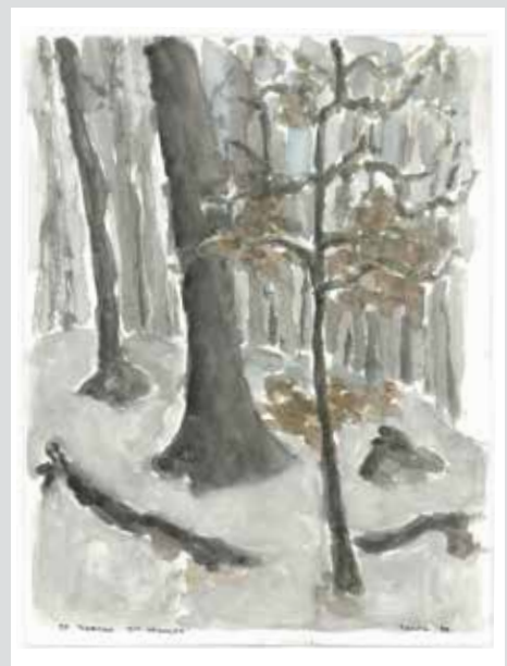
Im Honeret, 1982