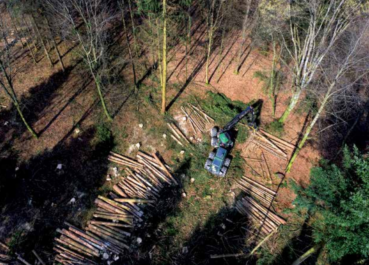
Vollernter an der Arbeit auf einer Rückegasse.

Mechanisierung, das in den folgenden Bauboomjahren benötigte Bauholz lokal bereitzustellen. Holz war gefragt und mit der Industrie erschlossen sich verschiedene neue Absatzkanäle. Das viel besagte goldene Zeitalter, als erst- und letztmals mit Holz richtig Geld im Wald verdient werden konnte und es zwischenzeitlich der Korporation sogar erlaubte, nebst Förster auch zwei Waldarbeiter einzustellen. Denn spätestens jetzt hatten sich die Zeiten geändert. Die Teilrechtsbesitzer konnten bei Weitem nicht mehr alle einfach so mit Ross und Wagen in den Wald beordert werden; man war auf zusätzliche Kräfte und neue Bewirtschaftungskonzepte angewiesen.