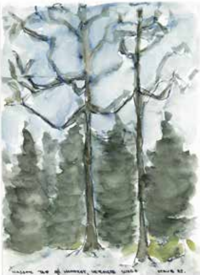
Nasser Tag im Honeret, vereiste Wege, 1982