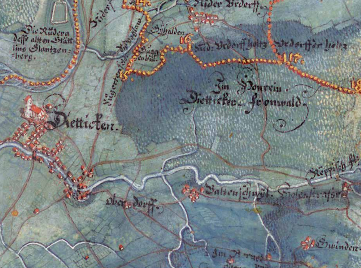
Ausschnitt aus der Gygerkarte von 1667.

«Lindenbühl», «Rütern» und «Holzmatt» auf dieses abgegangene Waldstück hin.