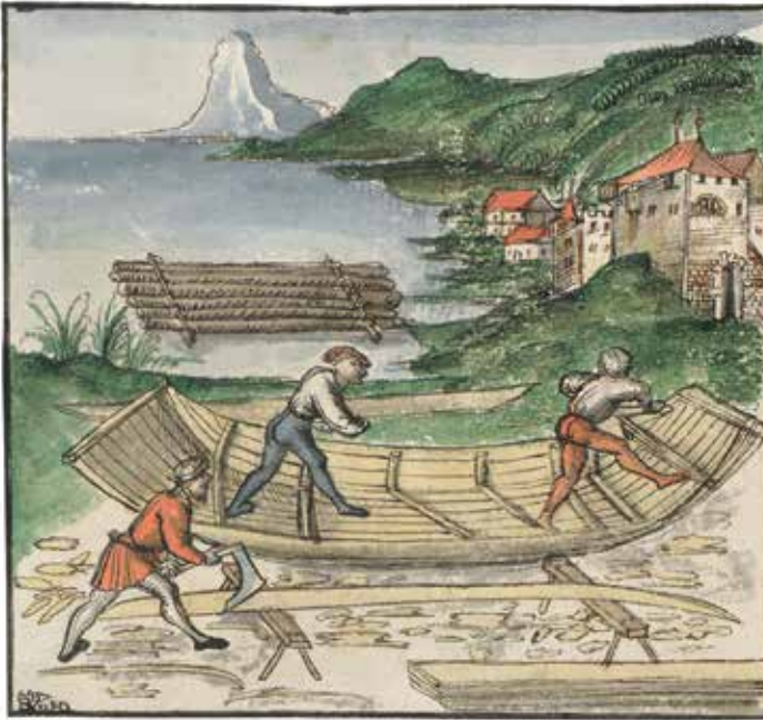
Schiffbau als Holznutzung im Spätmittelalter. Ausschnitt aus der Schweizer Bilderchronik des Werner Schodoler, 16. Jh., f. 115v.

dem Holz ihre Lagerfeuer zu unterhalten. Rücksichtslos legten die französischen Soldaten auch Hand an den Besitz der Dorfbewohner in Dietikon. Mensch und Vieh litten unbeschreibliche Hungersnot.