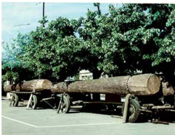
Holztransport für die Alterssiedlung Ruggacher, 1964.

Während und nach dem Revolutionsjahr 1798 machte sich allgemein in der Schweiz die Tendenz bemerkbar, die Gemeindegüter zu verteilen. In Dietikon zum Beispiel geschah dies tatsächlich mit der Allmend, indem deren einzelne Parzellen in Privatbesitz übergingen. Beim Wald war es anders: Die neue Gesetzgebung erlaubte zwar, dass der Wald weiterhin Gerechtigkeitsgut blieb, doch wurde er in Dietikon fortan von der Bürgergemeinde und nicht von den Holzgenossen verwaltet. Infolge der liberalen Entwicklung erliess der Kanton Zürich am 20./24. September 1833 ein neues Gesetz über Wirkung, Erwerb und Verlust des Bürgerrechts. Der § 28 bestimmte: «Wo Gemeindsgut (Bürgergut) u. Gerechtigkeitsgut [Corporationsgut] noch mit einander verbunden sind, da sollen diese Güter unter Mitwirkung des