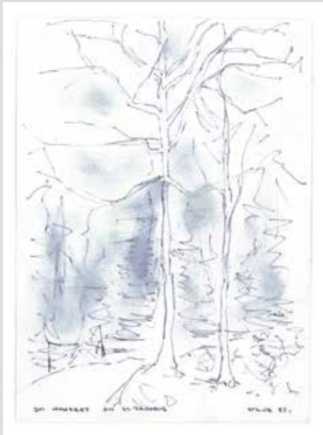
Im Honeret, 1982