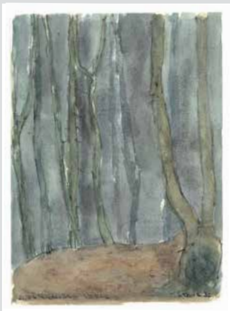
Aufsteigender Nebel, 1982