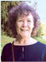
Zusammengestellt von Julia Hirzel