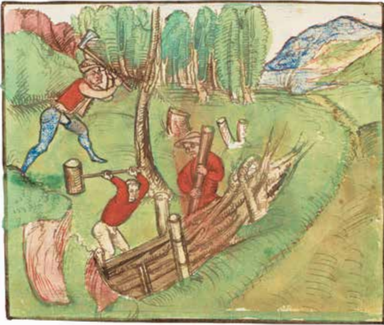
Palisadenbau als Holznutzung im Spätmittelalter: Ausschnitt aus der Schweizer Bilderchronik des Werner Schodoler, 16. Jh., f. 53v.

Das Nutzungsrecht am Dietiker Wald umfasste aber auch die Jagdbarkeit und den Vogelfang. Grundsätzlich erlaubte das Kloster Wettingen zwar die freie Jagd auf Hasen, Füchse und kleine Vögel – ausgenommen waren Rebhühner und Wachteln. Gänzlich verboten war dagegen das Erlegen von Hirschen, Rehen und Wildschweinen ohne die ausdrückliche Erlaubnis des Wettinger Abtes. Leider setzten sich aber die Menschen, ob Einheimische oder Fremde, immer wieder über diese Regelungen hinweg. Im 17. Jh. wurde offensichtlich derart übermässig in den Wildbann eingegriffen, dass das Kloster Wettingen sich genötigt sah, den Landvogt von Baden um Hilfe zu ersuchen. Daraufhin wurde am 17. September 1649 ein Gesetz erlassen, wonach das Tragen von «Feürbüchsen» in allen Wäldern innerhalb