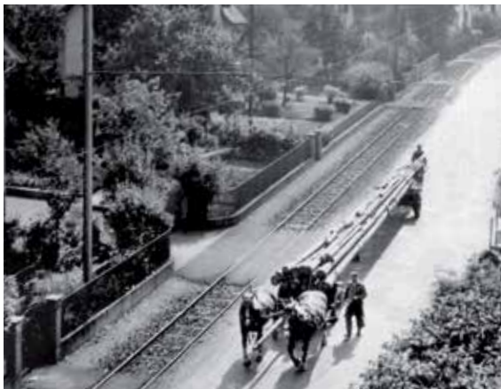
Langholztransport auf der Bremgartnerstrasse

Bis weit in die erste Hälfte des 19. Jh. war der Dietiker Wald von den Menschen übernutzt und ausgebeutet worden.