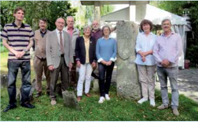
Der französische Vizekonsul zu Besuch im Ortsmuseum.