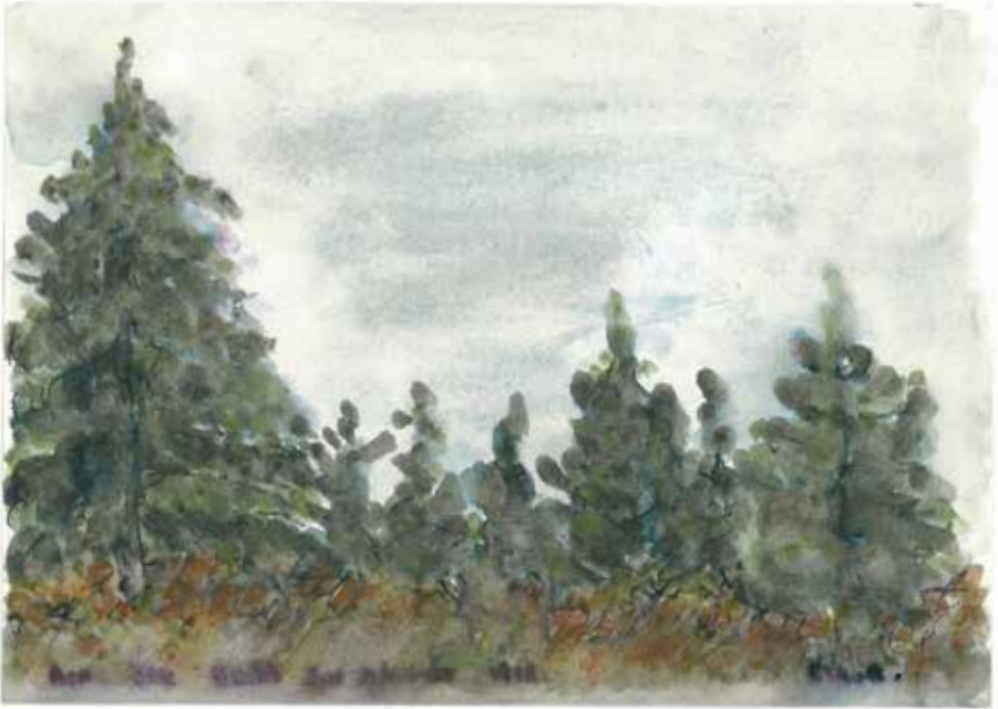
Ohne Titel, 1982