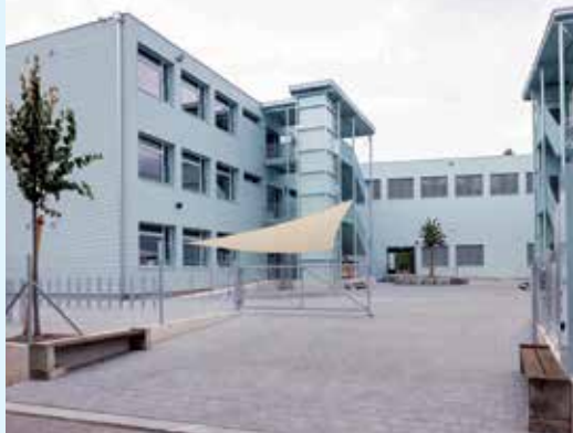
Die Tagesschule Stierenmatt im Limmatfeld.

zum Schulstart bezugsbereit. In der Tagesschule Stierenmatt, der ersten Tagesschule in Dietikon, hätten theoretisch 225 Kinder Platz, gestartet wird mit 90 Kindern. Im Doppelkindergarten Gjuch werden 2 Klassen à 20 Kinder geführt.