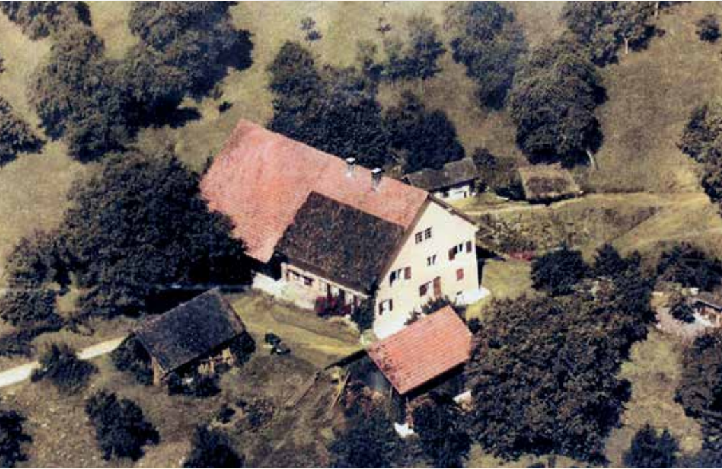
Der Bollenhof wohl kurz vor dem Abriss, ca. 1960.

zwei Wasserquellen und eröffnete so die erste öffentliche Wasserversorgung. 1896 begann allerdings auch die Stadt Baden die Wasserquellen am linken Hang des Limmattals systematisch aufzukaufen. Es folgte die Fassung von zwei weiteren Quellen im Gebiet Bollenhof. Weil aber die Bollenhof-Quellen topographisch höher liegen als die Laubibrunnen-Quellen, wurde somit durch die Stadt Baden ein Teil des Wassers der vorgängig durch Dietikon gefassten Quellen abgegraben. Darum entstand ein Streit.