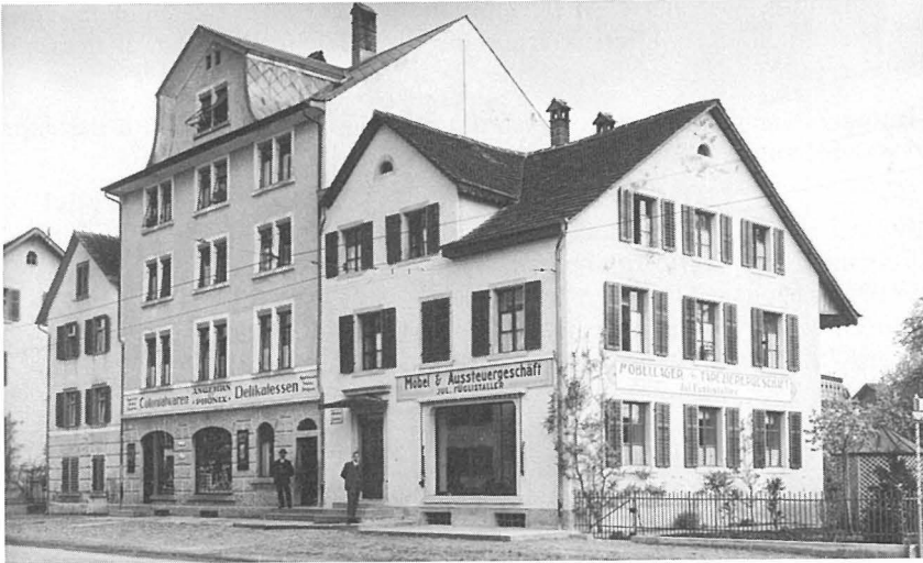
Das Haus Füglistaller an der Ecke Zürcherstrasse/Poststrasse um 1918. Links neben dem Eingang die Tafel «Naturalverpflegung Kontrolle».

auch nannte, überprüft und registriert wurden. Er weiss aus dieser Zeit zu berichten: