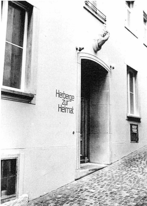
Herberge zur Heimat an der Geigergasse 5 im Zürcher Oberdorf, seit 1897 in Betrieb und 1983 renoviert.

«Im Juli 1931 wurde die Zahl der Betten von 106 auf 121 erhöht, indem fast in allen grösseren Schlafräumen weitere Bettstellen hinein-