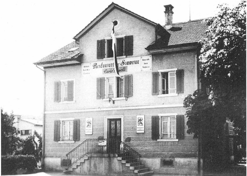
Die «Sommerau», Herberge von 1939 bis etwa 1960, vor dem Umbau von 1954. Das Restaurant musste 1967 dem Hotelneubau weichen.

Während der Zeit des Zweiten Weltkrieges entrichteten verschiedene Kantonalverbände ihren Herbergshaltern ein sogenanntes Wartegeld.