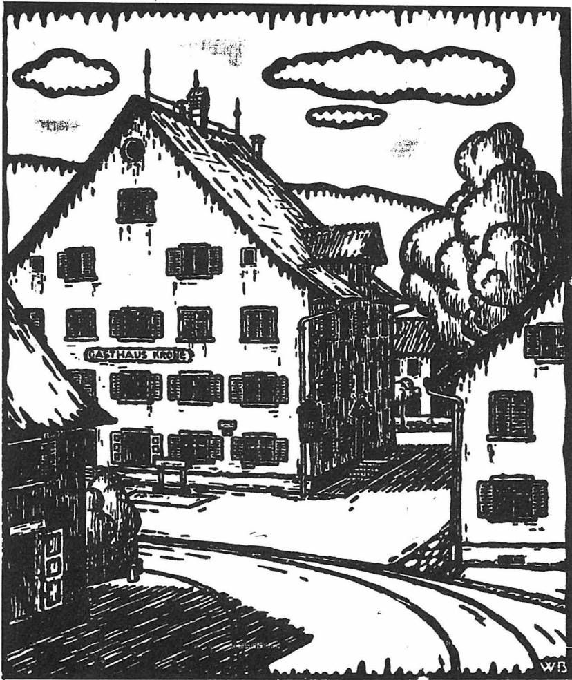
Gasthaus zur Krone nach einem Linolschnitt von Walter Benz (1921). Bei einem grösseren Andrang wurden die Wanderer auch im Haus rechts (alter Bären oder Zehntenscheune) untergebracht.

einmal verspätet kam, gab man ihm natürlich trotzdem noch etwas zu essen. Es kamen nach einem halben Jahr oft wieder dieselben Wanderer. Dann sagte ich: ‚Jaa, chömed ir scho wider?‘ Ich erhielt dann etwa zur Antwort: ‚Jo wüssed si, si händ so cheibe gueti Suppe; z Züri obe chunt me nöd so gueti Suppe über, z Baade a nööd.‘ Ich machte ihnen halt meistens eine Gersten- oder Bohnensuppe und dann legte