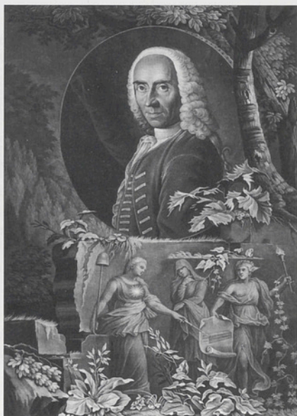
Bodmer, Johann Jakob. 1748 Breitinger, Johann Jakob. 1749