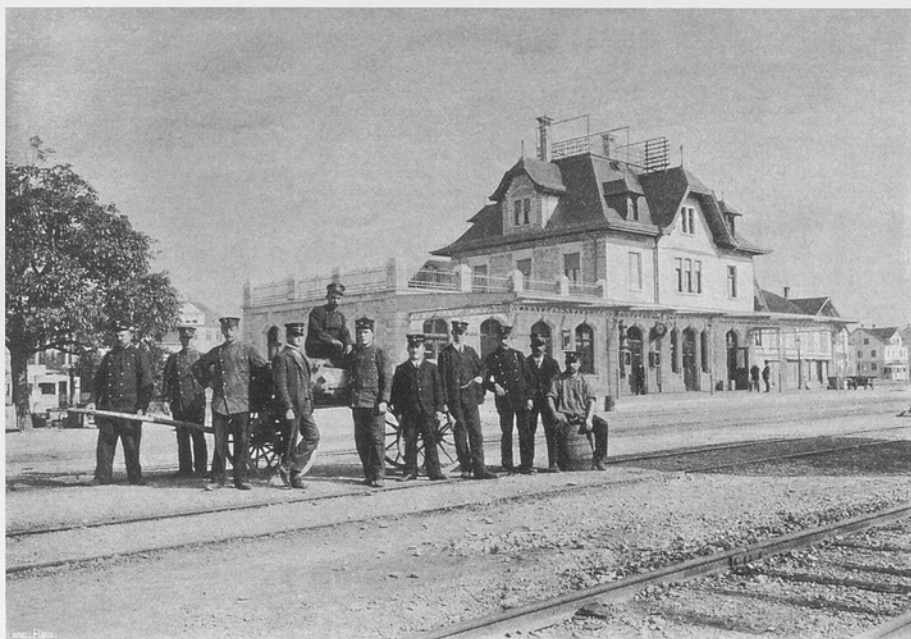
Das neue Bahnhofgebäude in Wetzikon