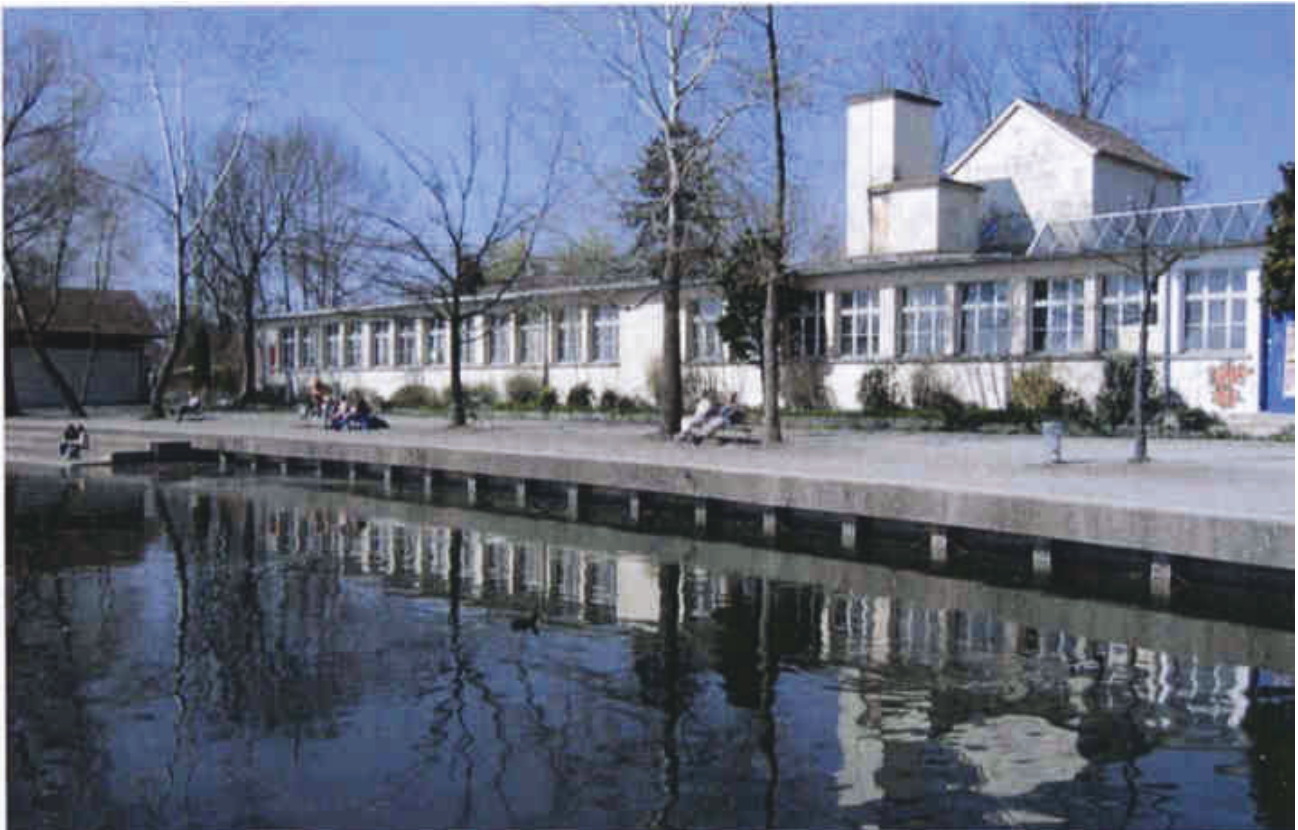
Die mehr als 100-jährige Drechslerei Bietenholz, Seequai Pfäffikon ZH, rückgebaut im Dezember 2006.

Die vom Gemeinderat daraufhin eingesetzte, gesellschaftlich breit abgestützte Arbeitsgruppe beleuchtete in einer Gesamtschau die Entwicklungsmöglichkeiten der gemeindeeigenen Freiflächen am See. Der Schlussbericht der Arbeitsgruppe Frei-/Ruderalfläche/Seequai, verabschiedet vom Gemeinderat am 13. Dezember 2005, bildet die Leitlinie für die angestrebte Entwicklung und hält u.a. fest: