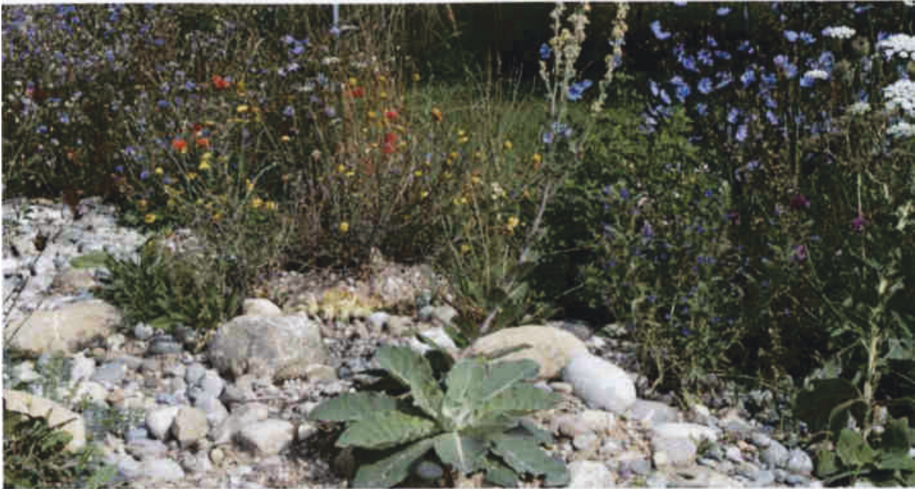
Blütenpracht einheimischer Pflanzen auf einer Ruderalfläche.