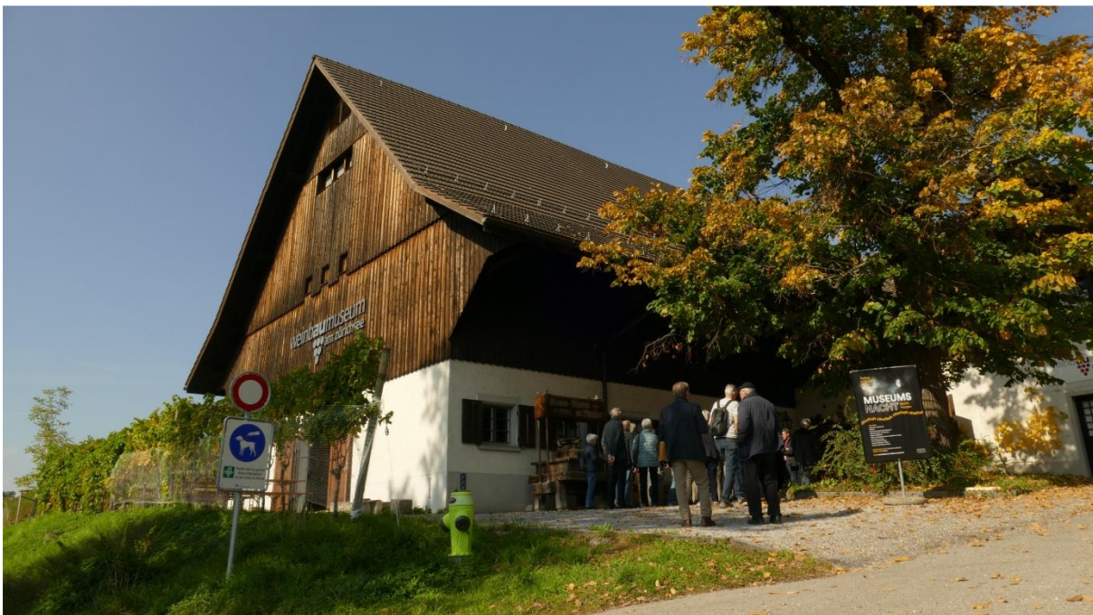
Das „Weinbaumuseum am Zürichsee“ in der angenehm warmen Herbstsonne

Der Rebberg des Museums diente auch schon dazu, zu erproben, ob eine maschinelle Ernte in der Schweiz sinnvoll ist. Technisch möglich war sie natürlich, jedoch hat sich die Methode nicht bewährt, da dabei das Aussortieren von schlechten Trauben nicht möglich ist und dadurch die Qualität des Weins leidet.