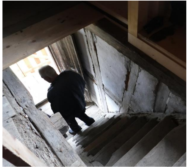
Die Treppen im Trottspeicher sind recht steil.