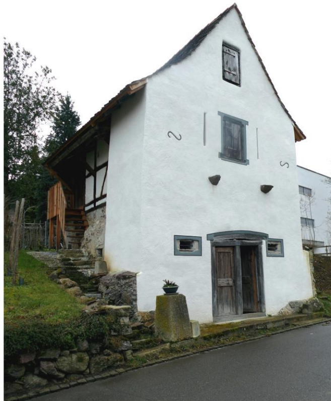
Der alte Trotspeicher in Dällikon – vor und nach der Restauration.