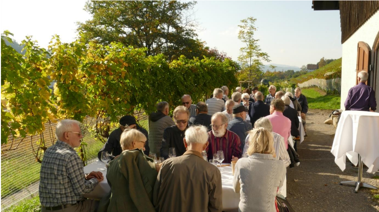
Anschliessend an die interessante Führung genossen alle die Weidegustation im Freien

Nach der Führung kam unsere Gruppe noch in den Genuss einer kleinen Weidegustation, bevor wir uns am späten Nachmittag, um einiges Wissen reicher, wieder auf den Heimweg ins Furttal machten.