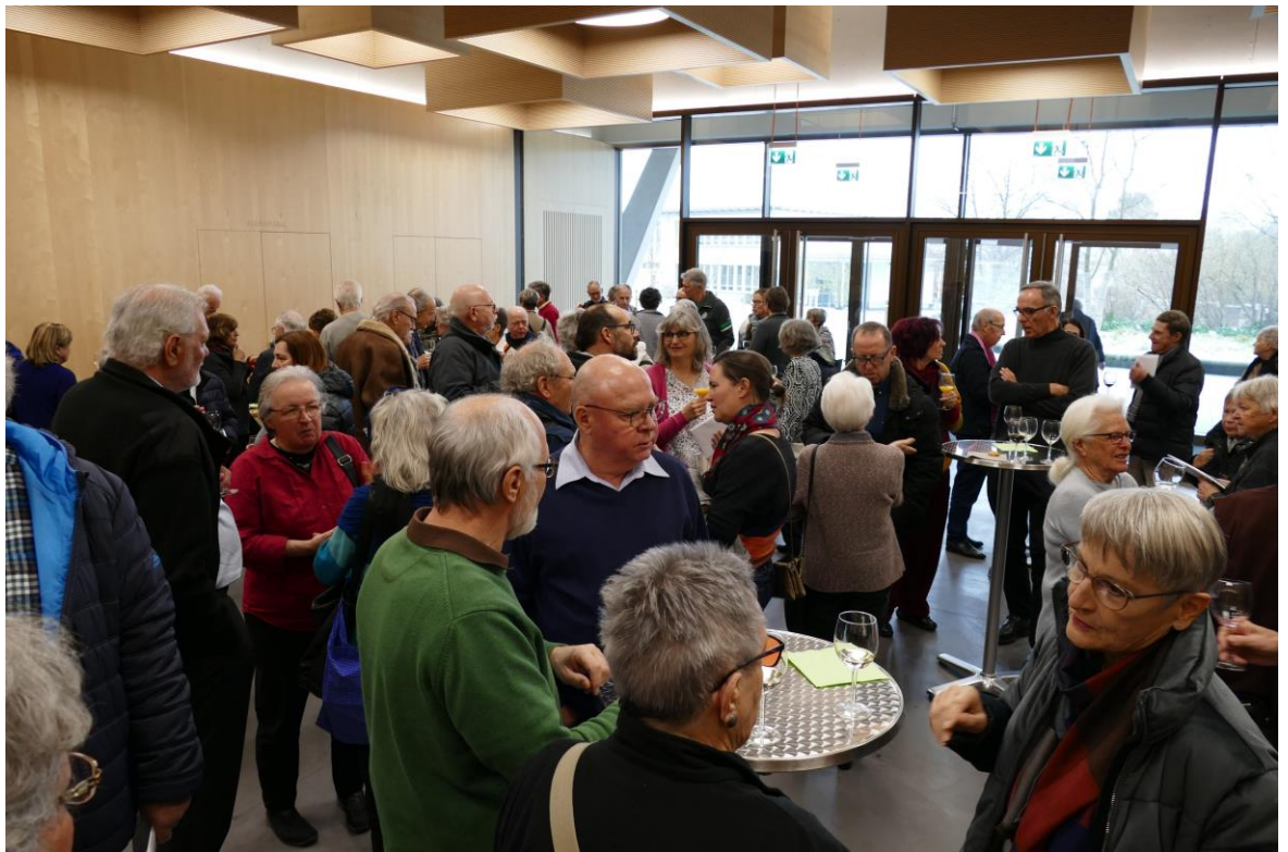
Nach dem spannenden Vortrag blieb man noch zum Apéro und anregenden Gesprächen.

Die Zeiten ändern sich, in den letzten Jahren vielleicht fast zu schnell, alles wird in Frage gestellt, und, mindestens, was das „Gedruckte“ betrifft, möglichst digitalisiert. Die Vorteile einer Digitalisierung der Mitgliederhefte lassen sich nicht bestreiten, sie würde nicht nur Papier, sondern auch Druckkosten sparen. Gerade die Druckkosten sind eine