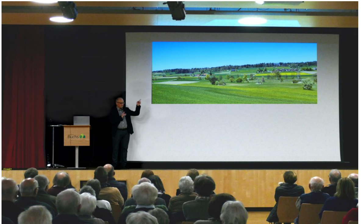
Dieser Hang wäre ohne das Schutzdekret heute wohl dicht überbaut.

Die 13 „Geschichten“, die Bannwart aufgenommen haben, decken ebenfalls ein weites Spektrum ab und gehen so weit, dass der Leser sogar erfährt, wie es dazu kam, dass die ersten Schweizer „Pomy Chips“ im Weiler Katzenrüti frittiert wurden. Den