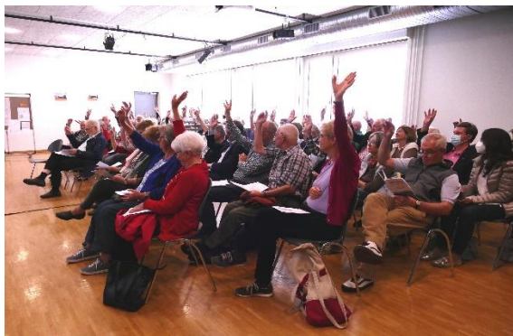
Die Mitglieder der Vereinigung stimmten den Vorschlägen des Vorstands zu.