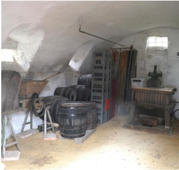
Der Rebverein nutzt den Gewölbekeller als Lager.

Der alte Trottspeicher von Dällikon, so wie er sich heute wieder darstellt, ist ein wahres «Bijou» und ein sehr gutes Beispiel dafür, was mit Begeisterung, Ausdauer und «Herzblut» engagierter Menschen erreicht werden kann.