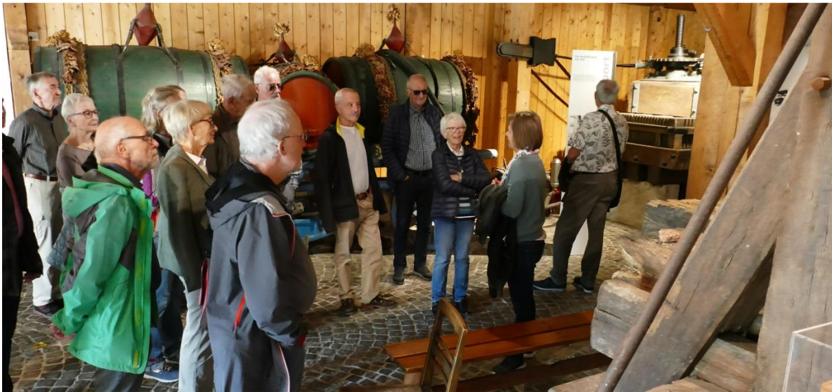
Während der ersten Teilgruppe die Funktion der Weinpresse erklärt wurde...