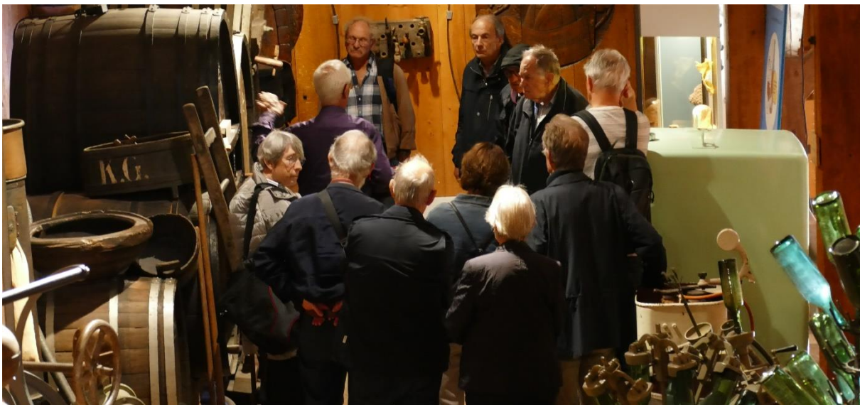
...erfuhr die zweite Gruppe Details zu Utensilien, die man früher zur Weinerstellung benötigte.