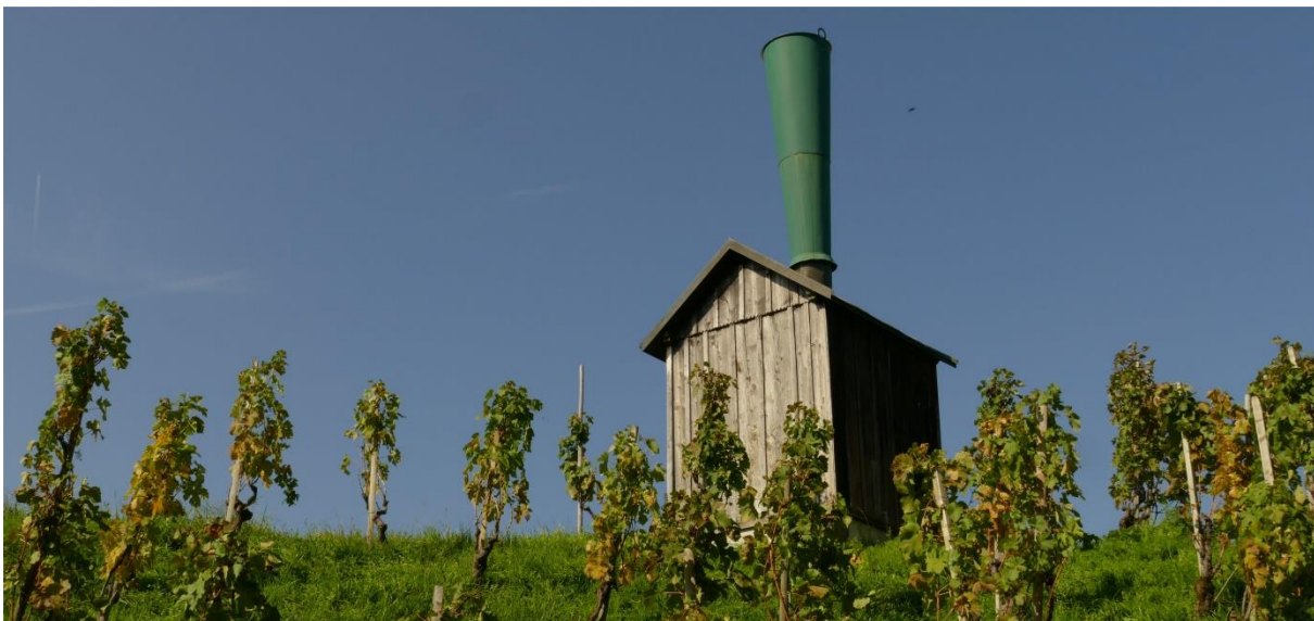
Die letzte noch existierende, der tatsächlich nutzlosen, Hagelkanonen am Zürichsee.