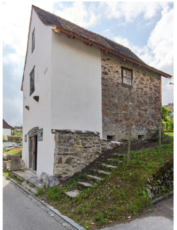
Der alte Trottspeicher in Dällikon – vor und nach der Restauration.