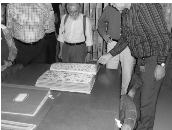
Textilsammlung: Stoffmuster- und Schnittmuster-Bücher