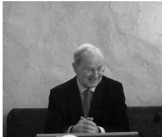
Autor Lucas Wüthrich