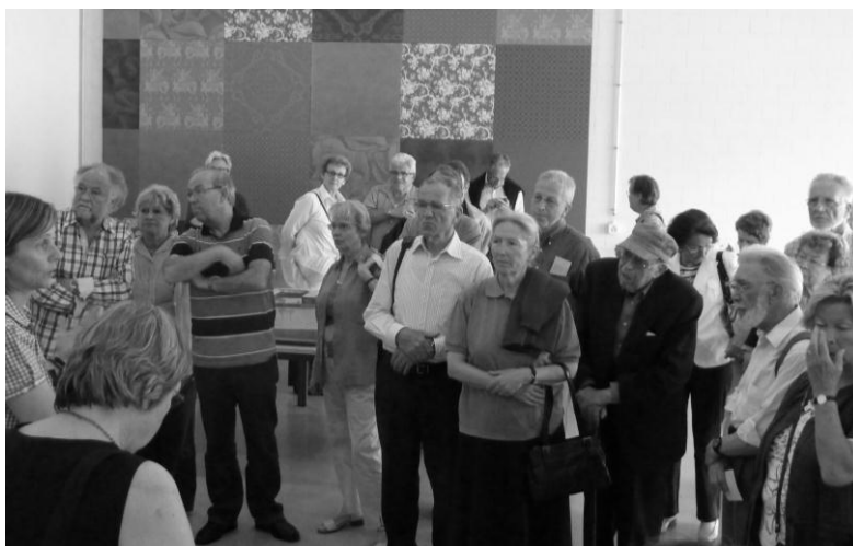
Unsere Mitglieder hören erste Informationen über das Sammlungszenrum

Schluss der Jahresversammlung um 14.35 Uhr.