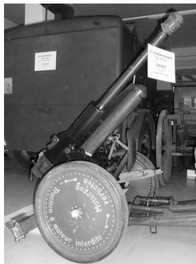
Infanterie-Kanone aus dem Jahre 1935