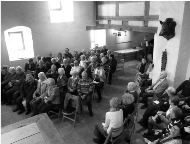
Mahlraum der Mühle Otelfingen