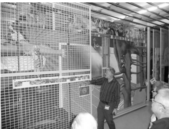
Das Landi-Bild von Hans Erni in Einzelteilen

Bei der Gemäldesammlung kann man unter anderem das Landi-Bild von Hans Erni „Die Schweiz, das Ferienland der Völker“ bewundern. Es wurde für die Landesausstellung 1939 geschaffen und ist 5 Meter hoch und weist eine Länge von über 90 Metern auf.