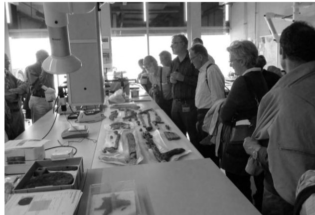
Einblick in ein Labor

Aus neuerer Zeit befinden sich in der Sammlung Gegenstände, die wir alle noch bestens kennen. Wer erinnert sich nicht an die Leuchtreklame der EPA oder der Swissair?