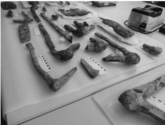
Ausgrabungsgegenstände vom Opernhaus Zürich

Auch die Archäologie ist vorhanden. In dieser Abteilung werden im Moment die Gegenstände, welche beim Opernhaus Zürich ausgegraben wurden, untersucht, konserviert, zusammengesetzt und katalogisiert.