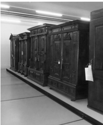
Teil der Schrank-Sammlung

Imposant ist die Halle mit den vielen Schränken aus einfachen Bauernhäusern oder aus Herrschaftsliegenschaften, welche entweder aufgestellt sind oder in Einzelteilen gelagert werden. Frau Zeier hat uns erzählt, dass sie ein historisches Hotelzimmer aus dem Grand Hotel Dolder in Einzelteilen besitzen, welches vor dem Umbau gerettet wurde.