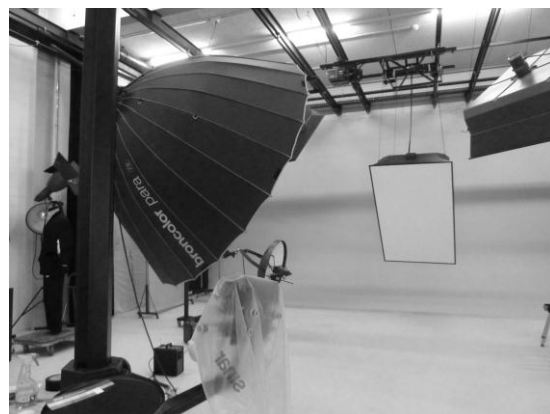
Einblick in das topmoderne Fotostudio